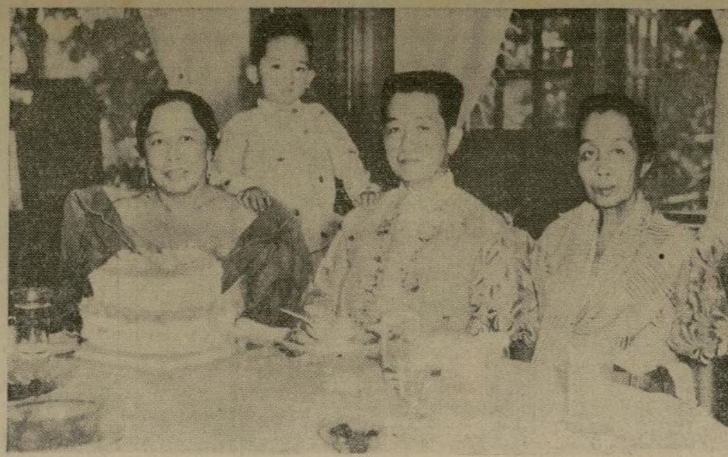
General Emilio Aguinaldo, líder de las fuerzas nativas después de la guerra entre Estados Unidos y España en 1898, con su esposa (izquierda), su hermana, doña Felicidad Aguinaldo, y su biznieto, en el 63 cumpleaños del héroe insurrecto celebrado en Kawit, Cavite.