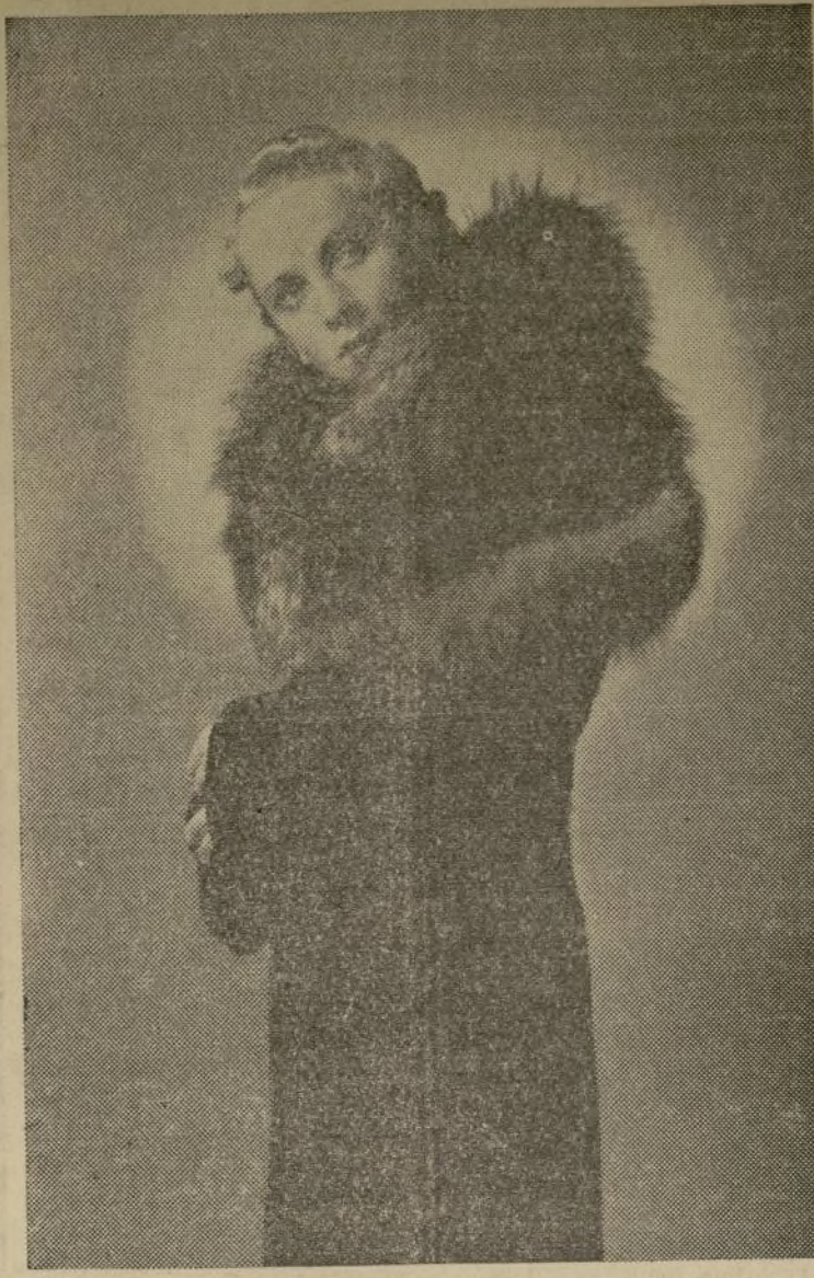
Paulina Singerman, joven y exquisita actriz argentina, figura principal de la Compañía Argentina de Comedia, que inaugura su temporada en Nueva York el próximo sábado, abril 17, en el Teatro Ambassador.

La Compañía de Comedia Paulina Singerman inaugura su temporada neoyorquina el 17.—El amplio Ambassador Theatre ha sido contratado para dos semanas.