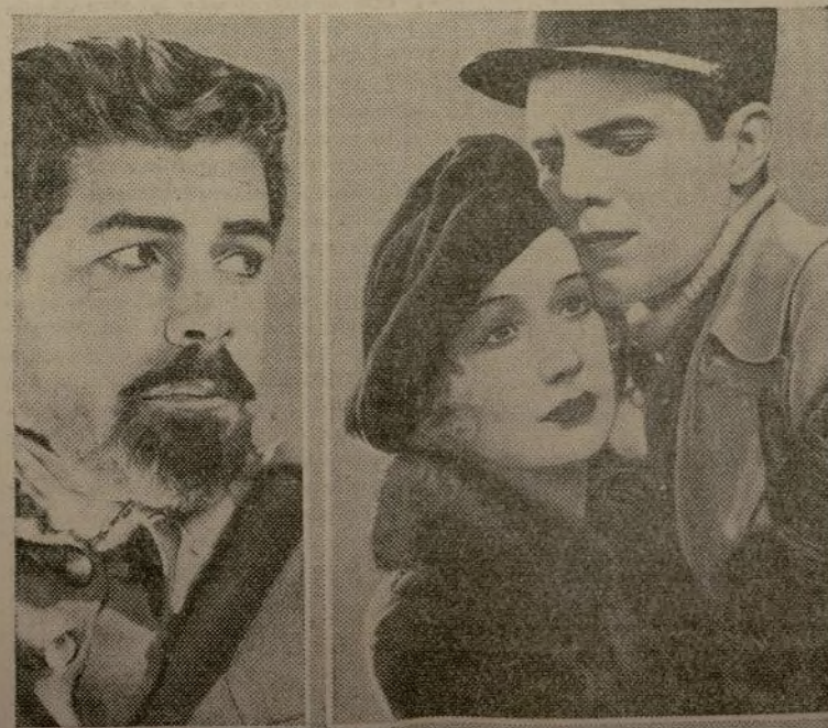
Paul Muni, Miriam Hopkins y Louis Hayward en la película "The Woman I Love" que presenta desde hoy el Radio City Music Hall.