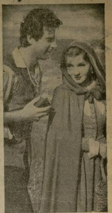
Claudette Colbert y Fred MacMurray, protagonistas de "Maid of Salem", que se relaciona con aquella época en que se perseguía a las "brujas" en Estados Unidos.

ayer fué empezada en los estudios de la Metro Goldwyn la película "The Firefly", en la cual también aparece como estrella principal la célebre estrella cantante de la pantalla sonora.