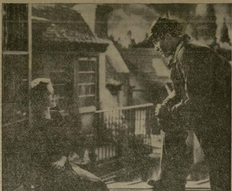
Simone Simon y James Stewart en la película "Seventh Heaven" que presenta el Teatro Regent desde hoy. Aparecen ellos en los papeles de Diana y Chico, respectivamente.