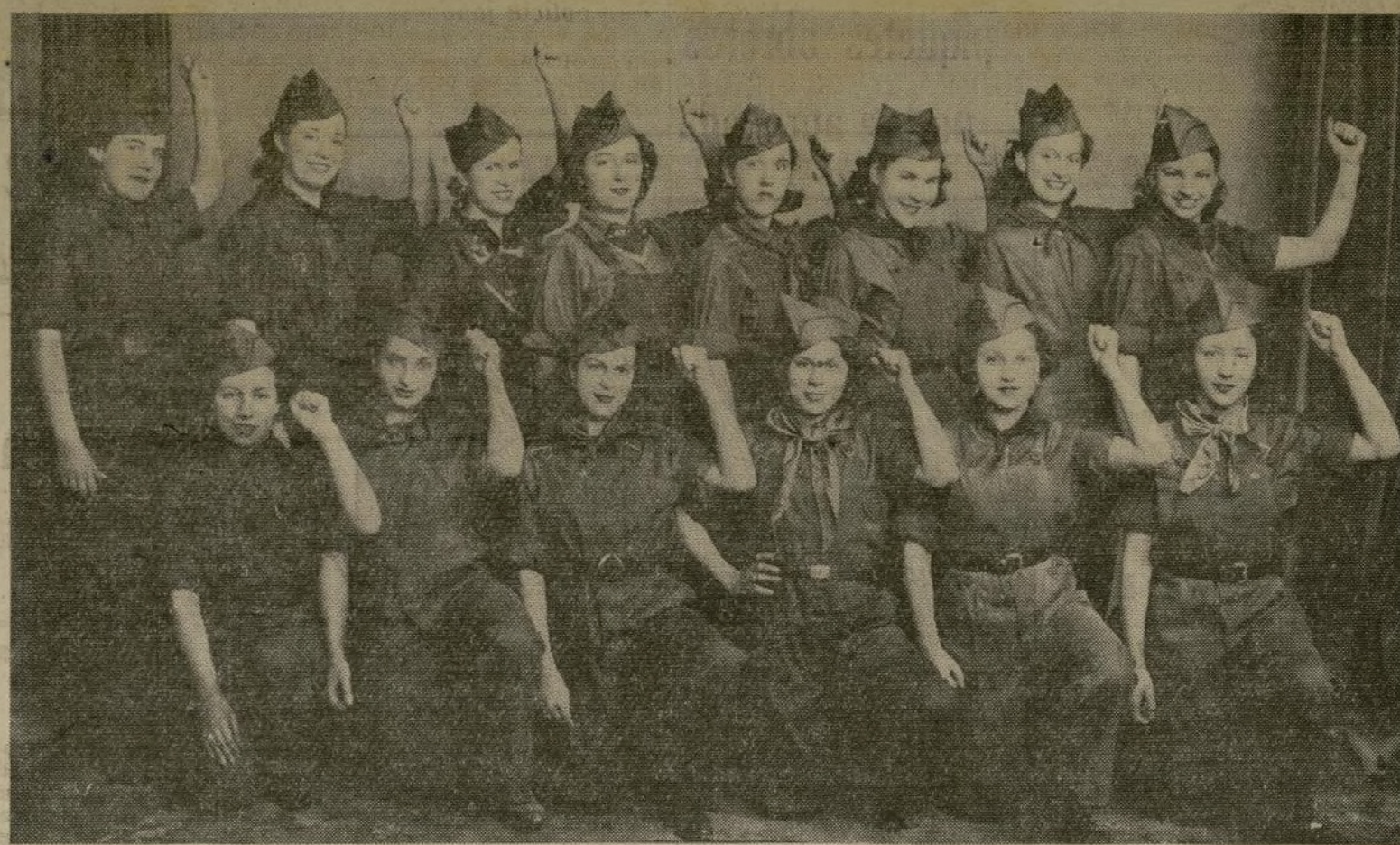
Este grupo de lindas damitas españolas colaboró anoche en el mitin del VI Aniversario de la República Española, colocando distintivos en las solapas de los concurrentes, y conquistando adeptos para la causa del Frente Popular Español. Actualmente tienen en preparación un festival bailable para el domingo día 25, en el que colaboran diversas organizaciones del Comité Antifascista Español, y promete culminar en un gran éxito.