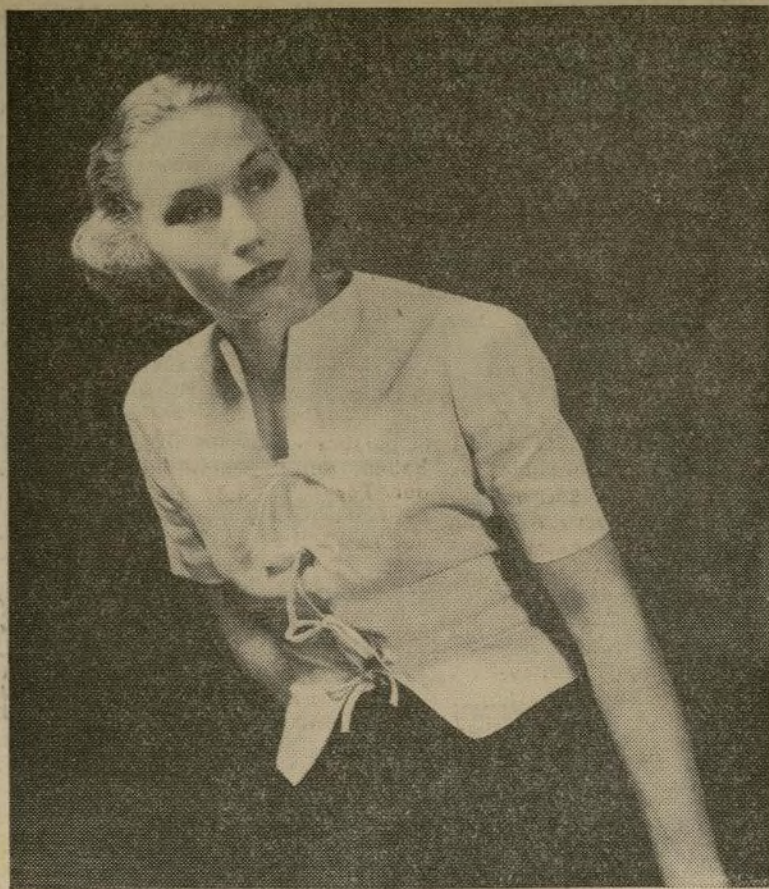
Esta blusa-chaleco en piqué blanco se vende en Lord and Taylor.

(NO DEJE QUE LA MODA LE USE—USE LA MODA)