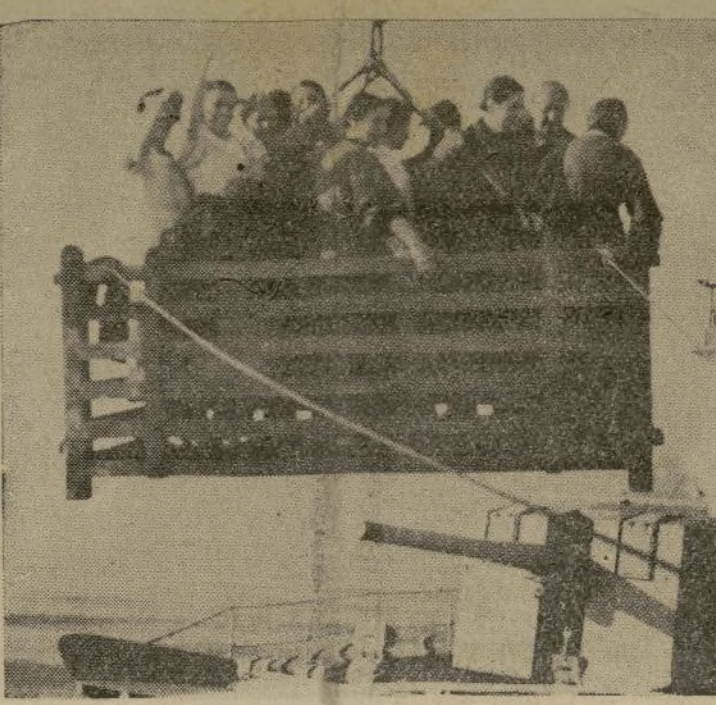
Un grupo de españoles de las regiones donde se combate, están siendo levantados hasta el puente de un destroy inglés que las condujo a Marsella.