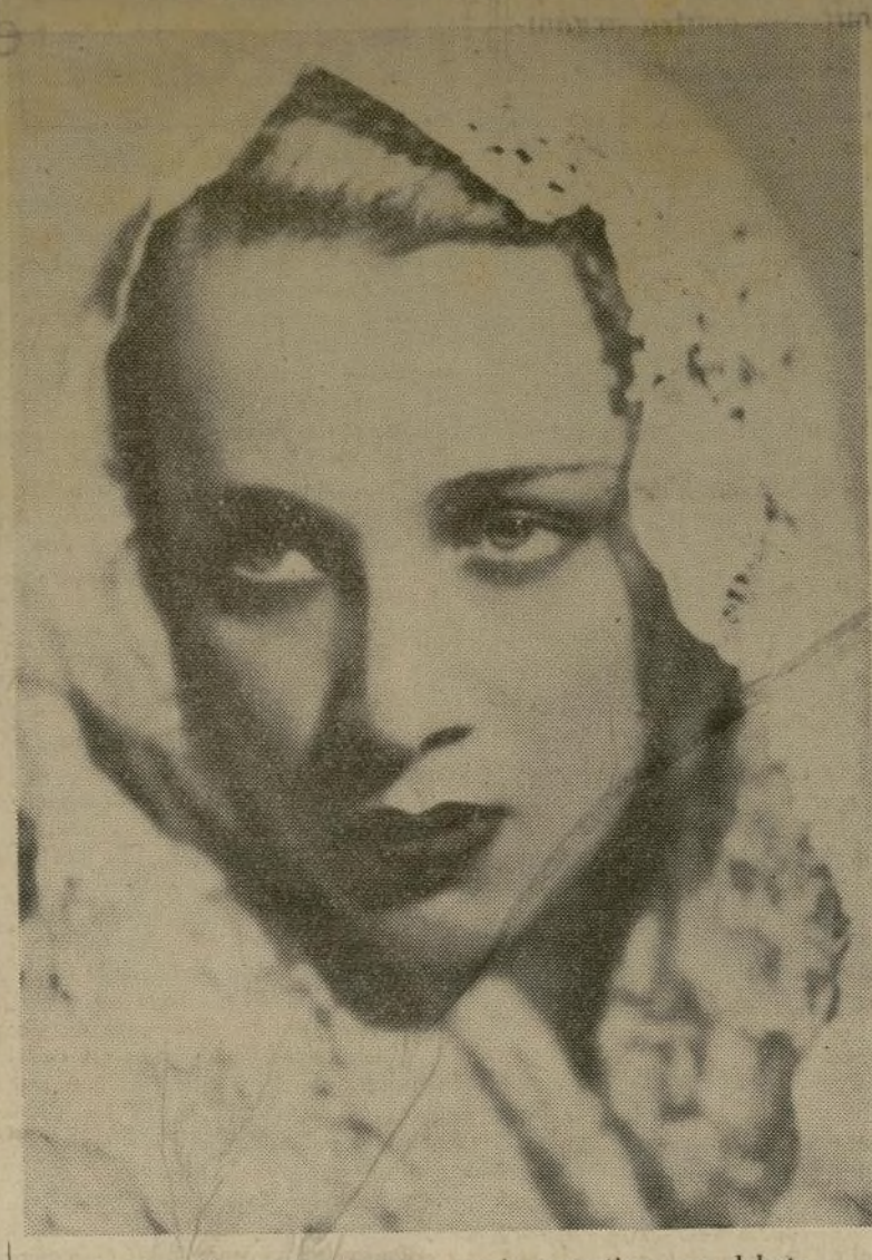
Paulina Singerman, la gran actriz argentina, que debuta el sábado aquí.