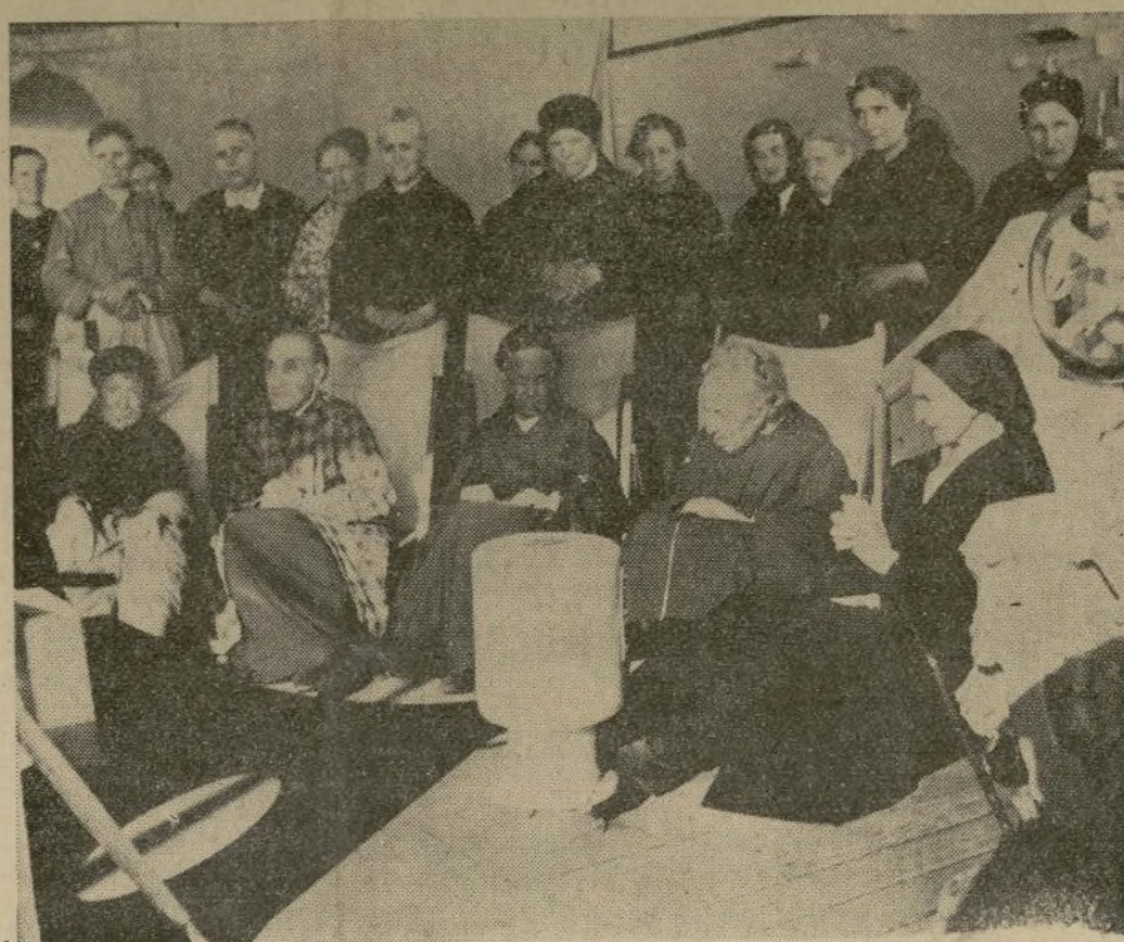
Monjas ancianas, ya sin los hábitos de sus órdenes, y vestidas con las ropas en que escaparon de la guerra civil de España, toman el sol a bordo del barco de guerra británico que las llevó a Marsella, Francia.