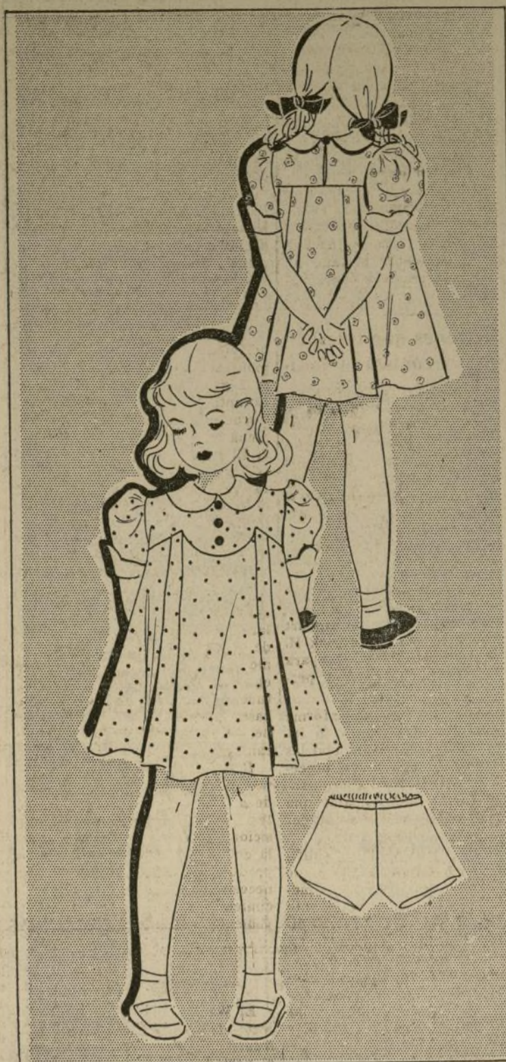
ENCANTADOR VESTIDO CON PANTALONCILLO

Si el polvo se queda muy pegado en los pisos que hayan sido encerados, humedézcase con un trapo con petróleo y frótese bien hasta que se le quite toda la cera. Después se le vuelve a poner otra nueva y se frota bien.