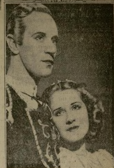
Leslie Howard y Norma Shearer, protagonistas de la película cuyo título encabeza este grabado y que desde hoy presenta el Teatro Loew's, Calle 116.