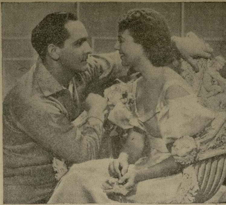
Fredric March, estrella máxima del cinematógrafo, y Janet Gayner, una de las más simpáticas actrices de todos los tiempos, quienes aparecen en los principales papeles de la película "A Star is Born" que presenta el Radio City Music Hall desde hoy.