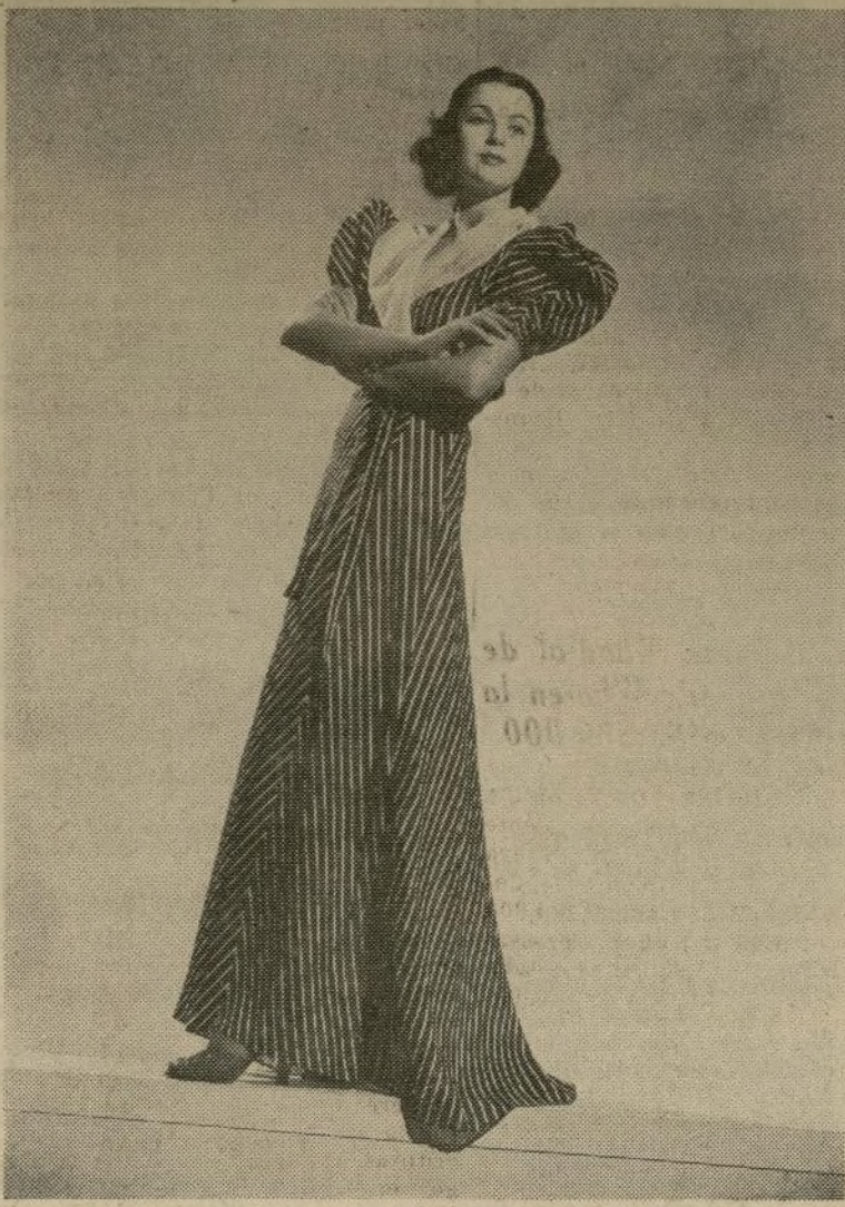
Esta bata viene de Best and Co. en tamaños de 12 a 20. Cuesta siete dollars y noventa y cinco centavos.

En Best, a pesar de la bata reproducida tiene otras, en algodones a cuadros, en organza, y