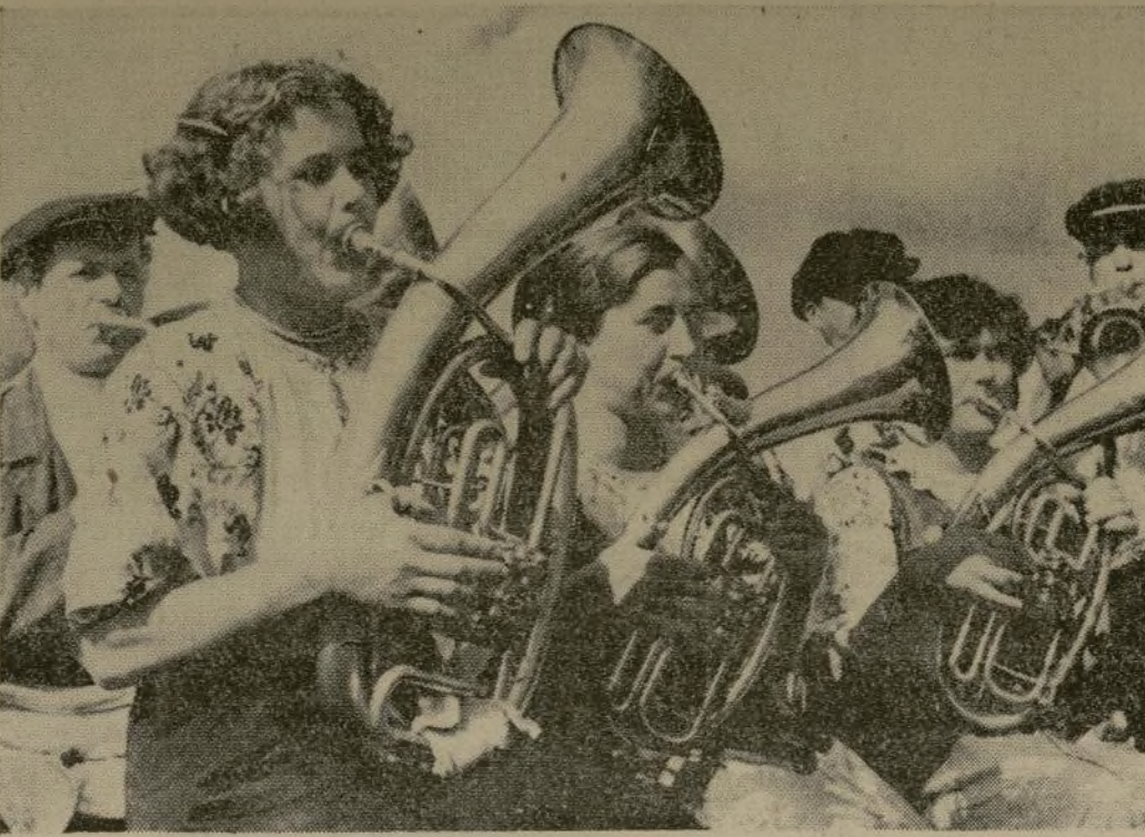
Una banda campesina formada por trabajadores y trabajadores de granja efectivas cerca de Stalingrad, ciudad en la parte baja del Volga que lleva tal nombre en honor del dictador de la Unión de Repúblicas Socialistas Soviéticas, tocando un programa en tributo a Josef Stalin durante una celebración realizada por los agricultores del distrito.