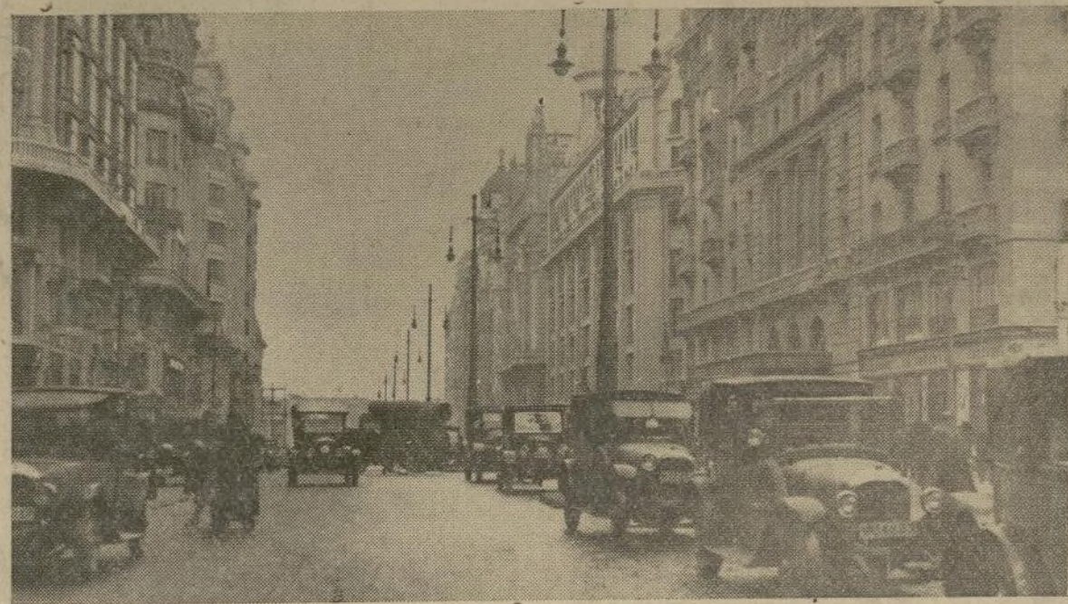
La Gran Vía, orgullo de Madrid, una de las avenidas más bellas de la capital española y de Europa, teatro ahora de una de las fases más dolorosas y sangrientas de la terrible guerra civil. Ayer fué sometida al bombardeo más copioso y horrendo que haya sufrido hasta ahora la heroica ciudad sitiada.

"UN MACABRO DEPOSITO DE CUERPOS MUTILADOS..."