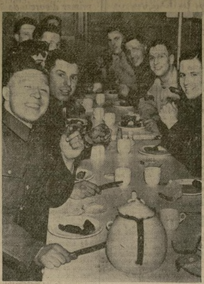
Soldados ingleses demuestran su franca aprobación a la adición de salchichas con puré de papas al rancho diario como parte del nuevo régimen para estimular el reclutamiento en las Islas Británicas.