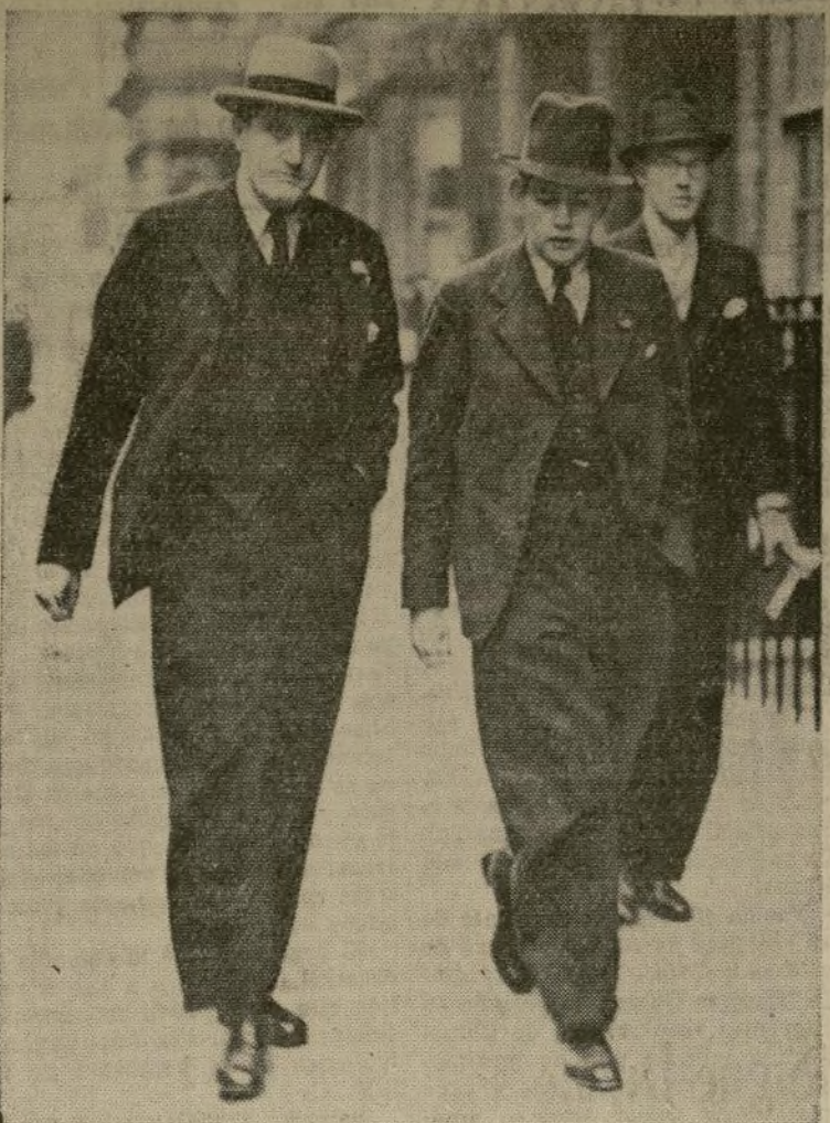
Ernst Hanfstaengl (izquierda), quien era amigo de Hitler en los días del “putch” de la cerveza en Munich y quien más tarde era el representante de prensa extranjera del Reich, paseando por las calles de Londres con un amigo. Se dice que Hanfstaengl temió prisión rápida o muerte repentina si regresara a Alemania.