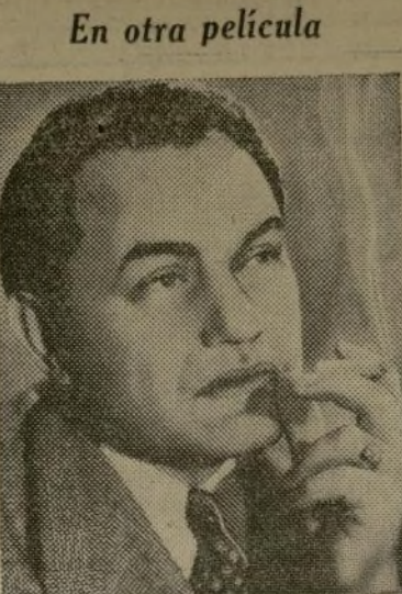
Edward G. Robinson, protagonista de la cinta "Thunder in the City" que ahora presenta el Teatro New Criticism.