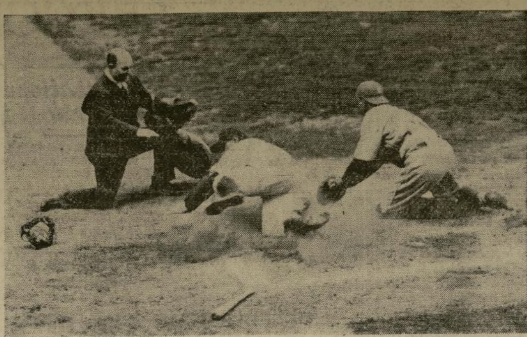
El "umpire" McGowan en el momento de decidir que Lou Gehrig llegó a salvo en la inicial para dar así a los Yankees una carrera más, mientras Hayes, el receptor de los Atléticos hace esfuerzos para tocar al corredor con la bola. Fue en este partido en el que los campeones mundiales escalonaron el primer peldano derrotando a Filadelfia por "score" de siete a uno.