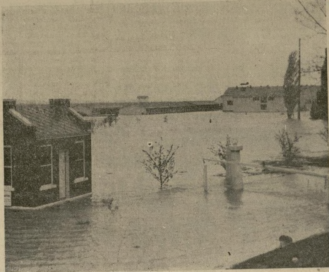
He aquí la estación aéreo-naval de Anacostia, inundada por las aguas del Potomac el cual, impulsado por el viento y con su cauce resacado por la lluvia se salió de sus bordes inundando alguna extensión de terreno. Las lluvias últimas han ocasionado crecientes en Pennsylvania, Ohio, West Virginia y Maryland, ocasionando algunas pérdidas de consideración.