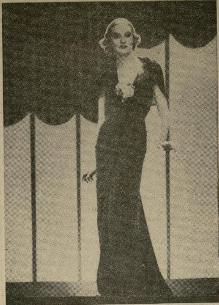
En Bonwit Teller's

Quizás les parezca pronto para comprar vestidos de campo pero aunque queda un rato antes de la estación de vacaciones no es demasiado temprano para mirar nuestra ropa del año pasado y así podemos decidir de antemano los cambios que vamos a hacer. Lo importante es planearlo así que lo que compramos este año haga buen conjunto con lo que nos resta del pasado. Cada una tiene su método. El mío es hacer una lista de todo lo que no voy a rechazar y luego imaginar ensembles, de lo que rechazaré, para las diferentes ocasiones que mi vida acostumbra. Mientras tanto hago una lista de lo que me hace falta. Trato de tener un vestido especialmente atractivo por cada ocasión en vez de gastar el bulto de mi dinero en vestidos de noche por ejemplo. Nunca se sabe cuándo se querrá estar lo mejor posible, y de esta manera se evita la tentación que destruye