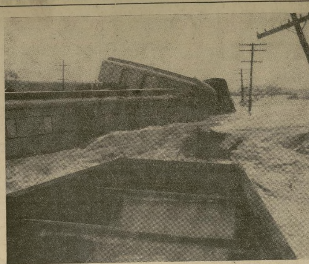
El expreso de Chicago a Montreal después de un accidente cerca de Ingersoll en donde los rieles habían sido arrastrados por las turbulentas aguas del río Támesis, que inundaron la vecina ciudad de Londres, causando daños por valor de $3,000,000, escasez de alimentos, de agua potable y energía eléctrica, y que dejó cinco muertos y seis mil sin hogar.