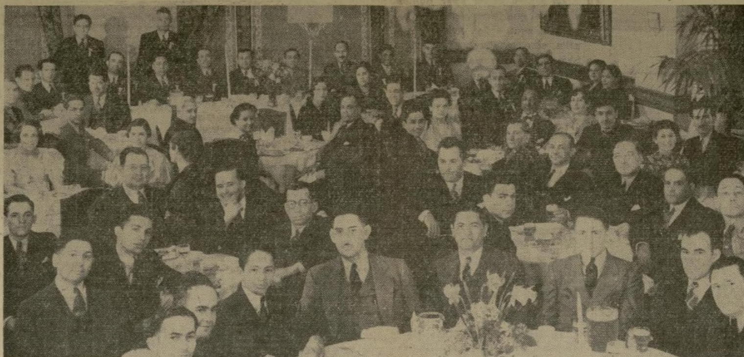
Vista parcial de la concurrencia al banquete que en honor al púgil puertorriqueño, Pedro Montañez se celebró el sábado último por la noche en un hotel en Brooklyn y a cuyo acto asistió un crecido número de amigos y simpatizadores del boxeador boricua.