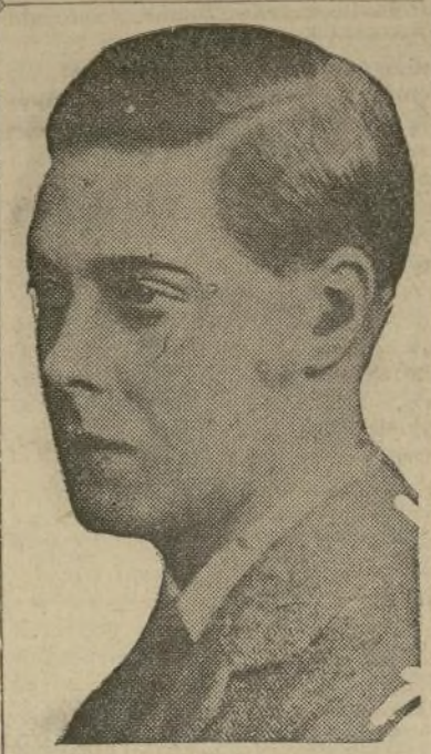
Duque de Windsor

La dama nacida en los Estados Unidos y el caballero cuya