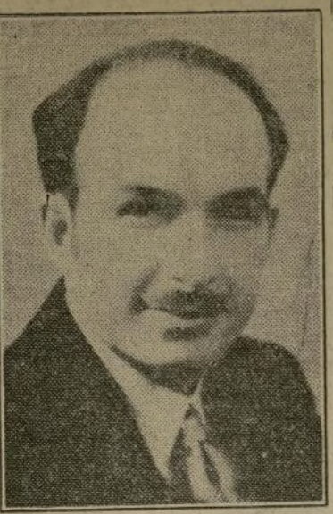
Xavier Cugat, director hispano de orquesta quien aparecerá en el Teatro Paramount de esta ciudad desde hoy en un dueto con una célebre orquesta americana.