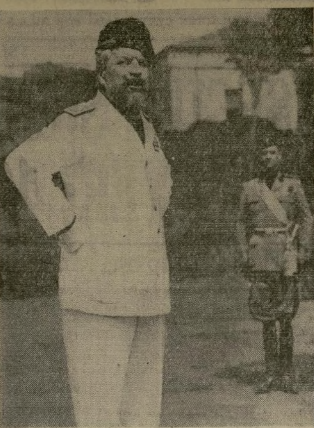
El general Attilio Teruzzi, organizador de milicias fascistas, que fue enviado a España a raíz de la desastrosa derrota italiana en Guadalajara. Su ausencia en el funeral de su hermana descubrió que había ido a España.