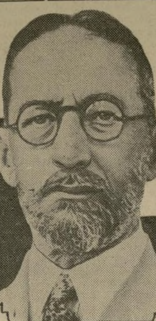
General Mario G. Menocal