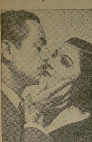
William Powell y Myrna Loy en la película "Manhattan Melodrama" que presenta el Teatro Loew's de la C-116, desde hoy lunes.