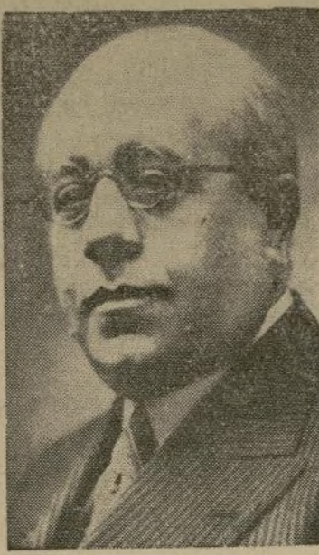
Don Manuel Azaña Presidente de España

7:30 A.M.—El rey y la reina salieron del Palacio de Buckingham para la Abadía de Westminster para la coronación.