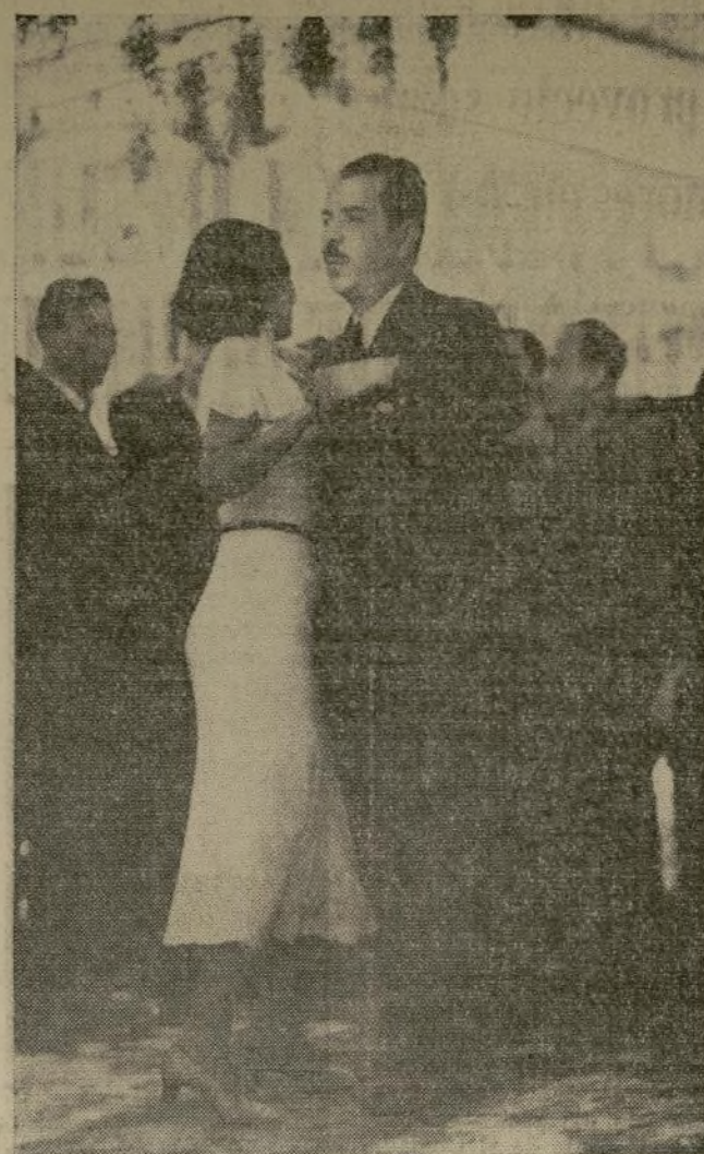
El presidente Lázaro Cárdenas, que generalmente rehuye toda clase de funciones sociales de etiqueta, baila en cambio gustosamente con la modesta esposa de un soldado durante un reciente festival en honor del ejército nacional.