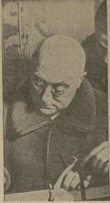
General José Miaja