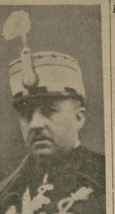
General Francisco Franco