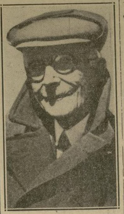
John D. Rockefeller, Sr.

Expiró a las 4:05 a. m. en su residencia invernal "The Casements", en Ormond Beach, Fla. — Su médico atribuyó el fin a endurecimiento de músculos del corazón. — Ninguno de la familia estaba a su lado. — Será sepultado en Cleveland.