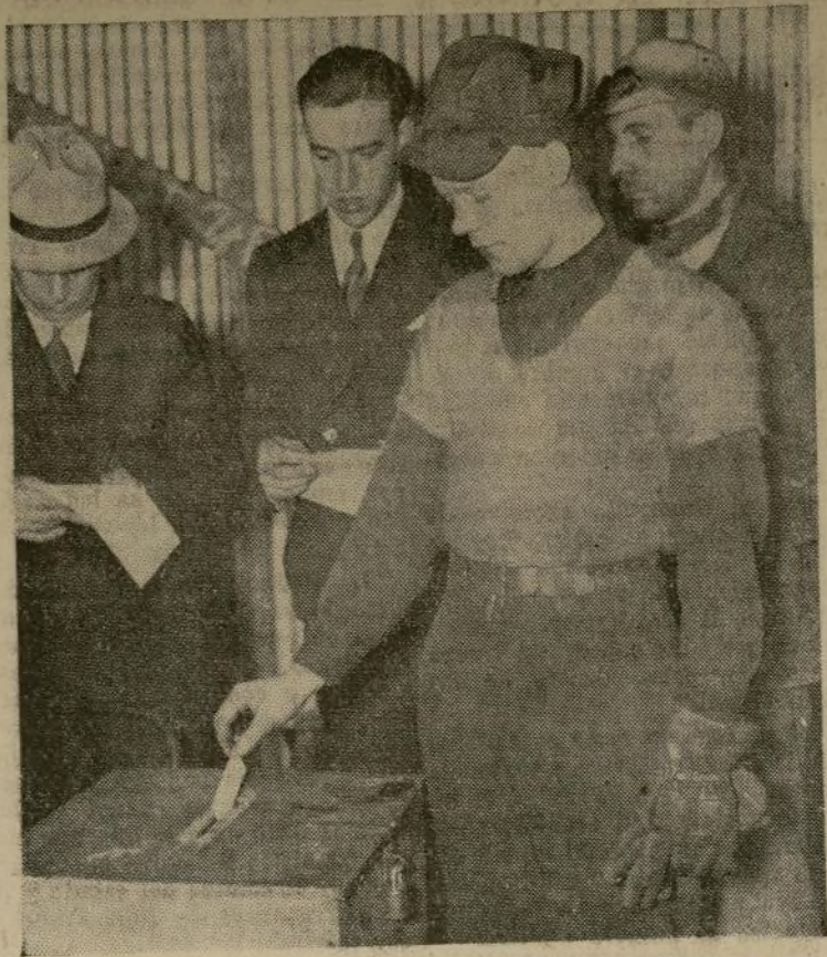
Un trabajador en la fábrica de la Jones & Laughlin Steel Company, en Pittsburgh, vota en la elección para determinar si el C.I.O. debe representar a todos los empleados en las negociaciones colectivas. De los 24,412 votos consignados, 17,028 favorecieron al C.I.O.