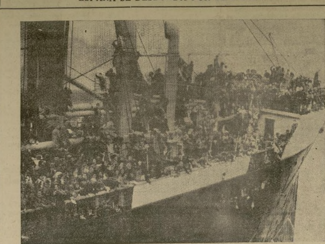
El "Habana" llega felizmente a Southampton, Inglaterra, con su cargamento de 3,800 niños, a salvo de las bombas rebeldes. (Varios miles han sido llevados a Francia; Méjico ha reclamado su parte; Estados Unidos, dice, también recibirá; Rusia tiene ya algunos y en Argentina pretenden recibir 5,000).