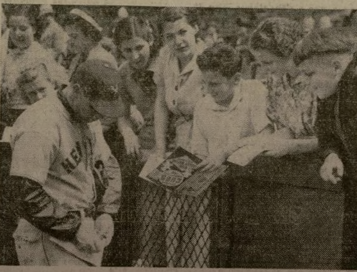
Bill Terry, gran jugador y "manager" de los New York Giants, concede docenas de autógrafos a chicos admiradores en Wrigley Field, Chicago, sede de los "Cubs."