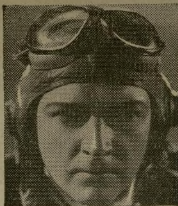
William Gargan, quien toma parte en la película "Wings Over Honolulu" que exhibe el teatro de la corriente semana.