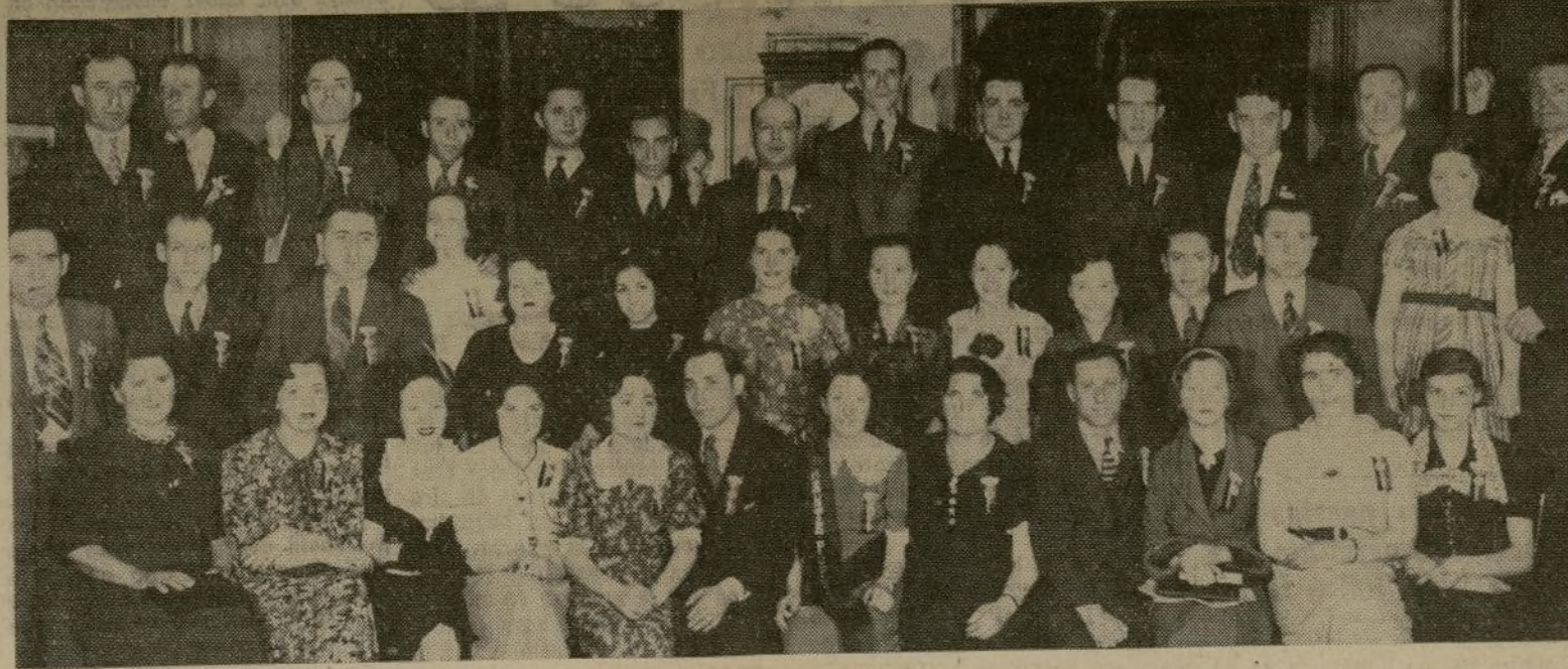
Este grupo mixto está finalizando los detalles del baile "Los Mineros" que mañana sábado por la noche celebrará en el Irving Plaza, a beneficio del Frente Popular Español, amenizado por competente orquesta, y cuenta con la colaboración de un amplio círculo de la colonia hispana.