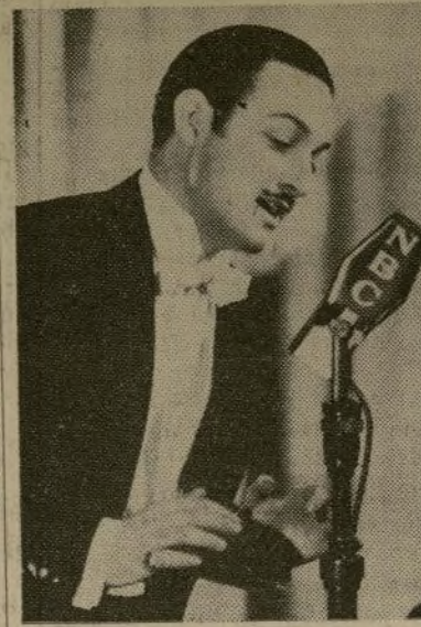
Jorge Negrete, popularísimo baritono mejicano y artista del radio que actúa actualmente en el Club Yumuri, como cantante y maestro de ceremonias.