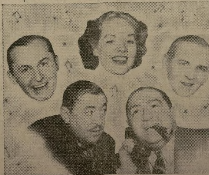
Mack Gordon, derecha y Harry Revel, pareja de compositores de canciones de Hollywood que presentan nueve de sus producciones en la película "Wake Up and Live", cinta de la "20th Century" que presenta el Teatro Regent. Walter Winchell, Ben Bernie y Alice Faye, protagonistas de la película aparecen de izquierda a derecha en la parte superior del grabado.