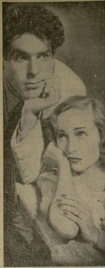
Fred MacMurray y Carole Lombard, protagonistas de la película "Swing High, Swing Low" que presenta el Teatro Loew's de la Calle 116.