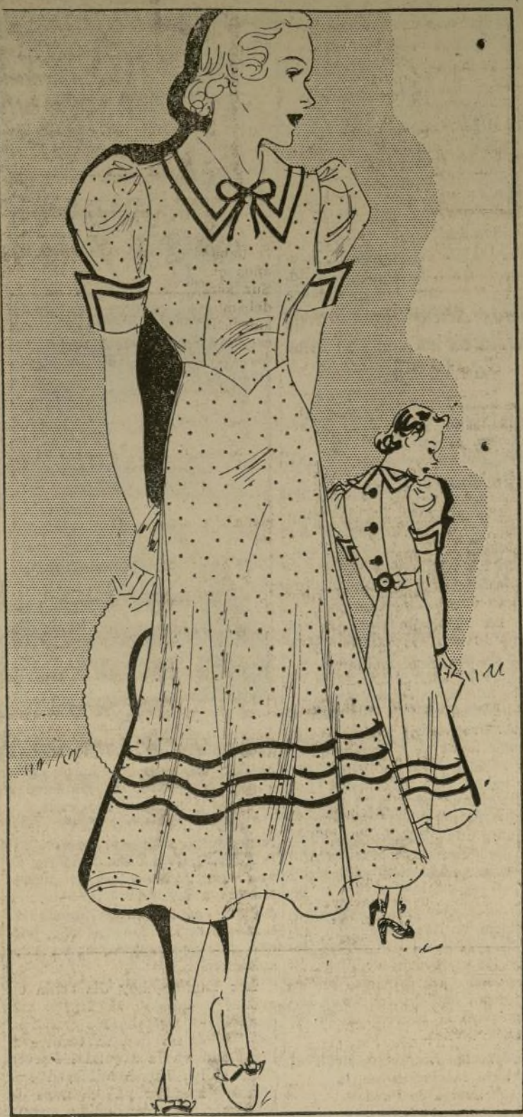
VESTIDO MUY JUVENIL CON BLUSA ESTILO CORPIO

Puede conseguirse en los tamaños 12, 14, 16, 18, 20 y 40, que corresponden a las medidas de busto 30, 32, 34, 36, 38 y 40. Para la medida 12 (30) se emplearán 4 yardas y media de material que tenga 39 pulgadas de ancho, más 11 yardas de cinta para el