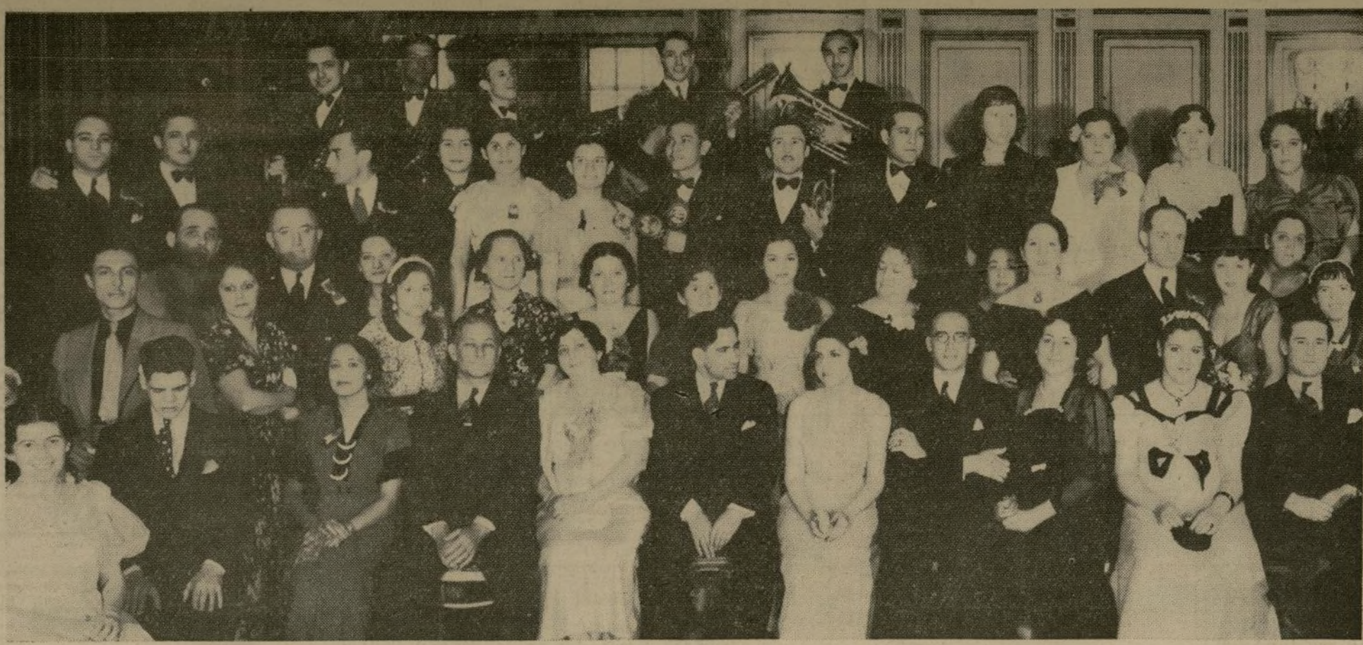
La presente fotografía muestra parte de la concurrencia que asistió a la velada bailable celebrada por esta organización el día 28, con el objeto de obtener algún producto y destinarle a mejorar la situación de los infelices ciegos, que se afanan por elevar su condición aquí y en otros países.