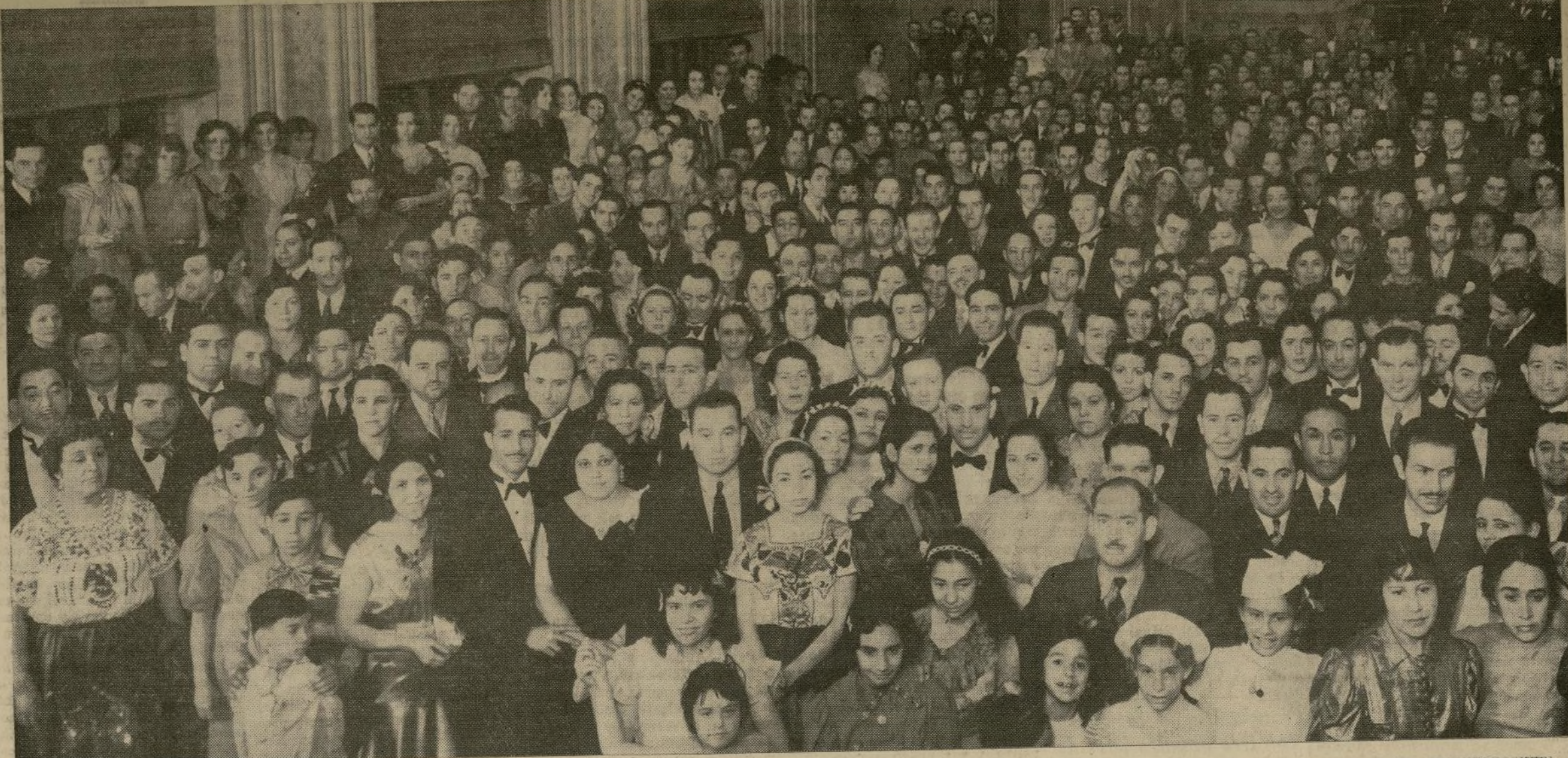
Concurrentes al brillante festival celebrado por esta organización el sábado con motivo de su primer aniversario, y al que asistieron los señores representantes consulares de México, conocidos elementos representativos de su colonia y presidentes de las agrupaciones mejicanas.