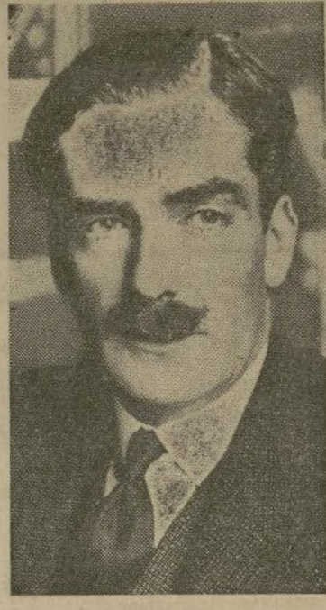
Izquierda: Dr. Juan Negrín Centro: Benito Mussolini Derecha: Anthony Eden