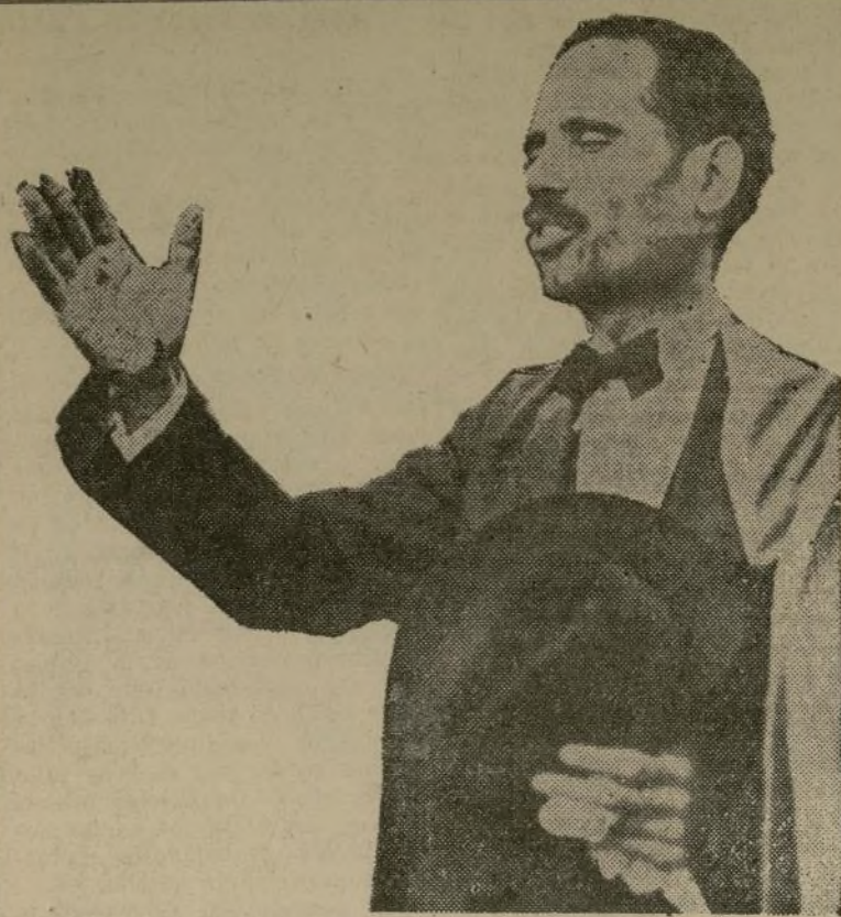
Licenciado D. Pedro Albizu Campos