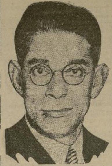
General Emilio Mola