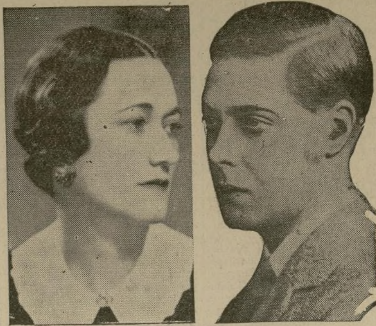
Duquesa de Windsor