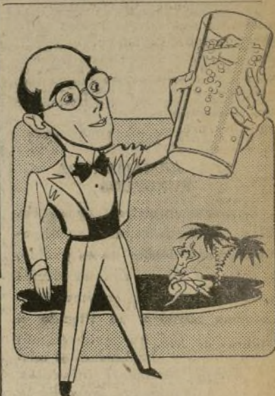
LOS NORTEAMERICANOS me han tratado muy bien

Para remitir por correo, por cada libro... $1.00 C.O.D. No envíe dinero suelto por correo. — Use cheque o giro postal.