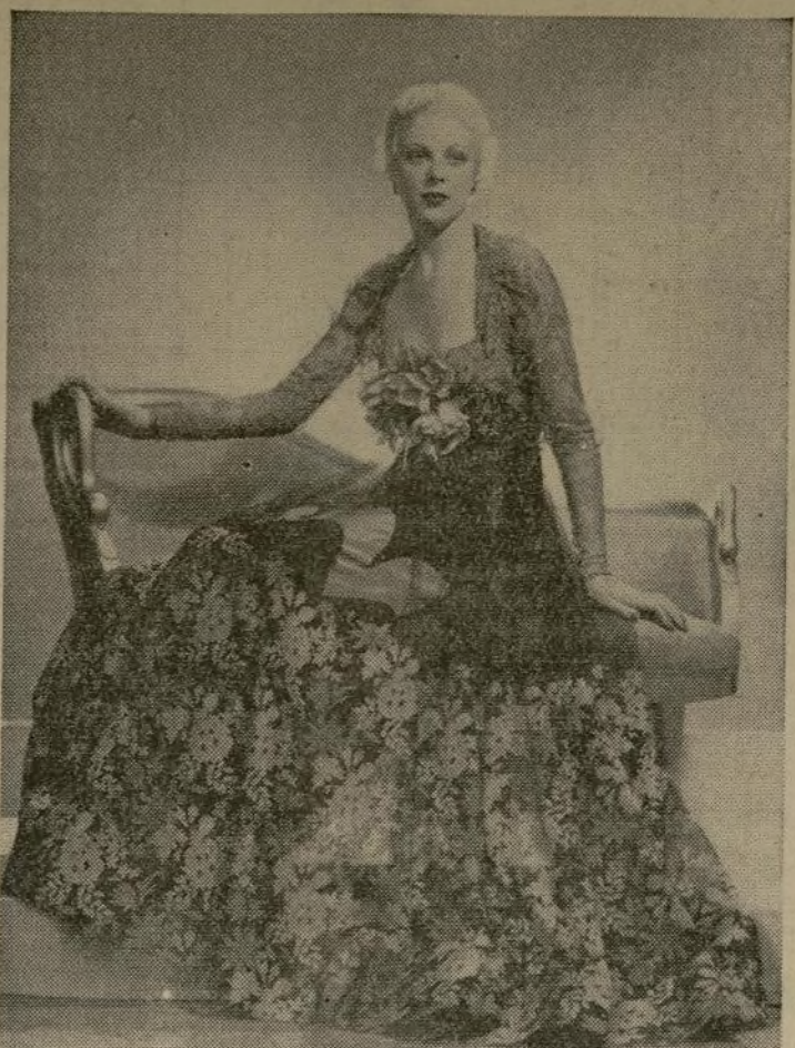
VESTIDO PROPIO PARA FIESTAS, EN NOCHES CALUROSAS: Muy elegante es este modelo de encaje bordado azul oscuro y combinado con tul negro. El escote rebajado y cortado cuadrado. Las mangas largas y ceñidas.