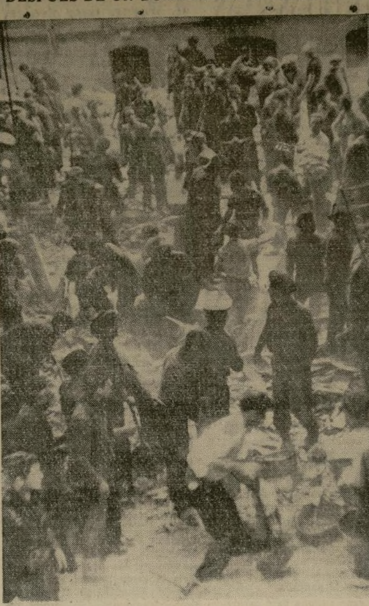
Trabajadores buscando muertos y heridos entre los escombros en la gran ciudad industrial española, después de que tres aeroplanos trimotores rebeldes habían causado grandes pérdidas al concentrar su ataque a los edificios de un distrito de residencias de obreros.