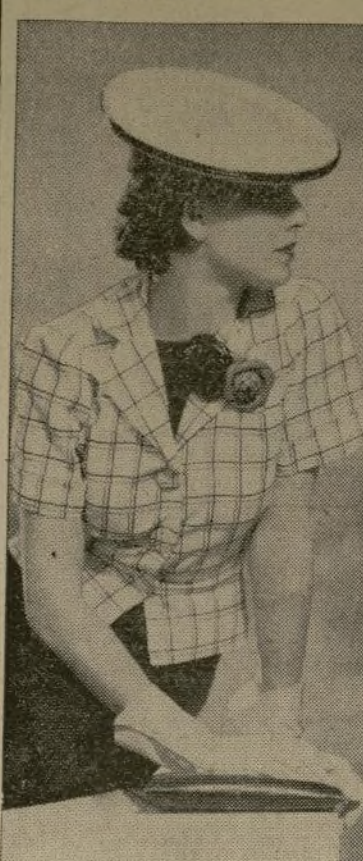
TELAS DE LUNARES Y RAYAS DAN ASPECTO VERANIEGO: Te de piqué con rayas satinadas, en blanco, amarillo dorado y negro, forma un contraste muy atractivo para los días de verano en combinación con el vestido negro que aparece en el grabado.