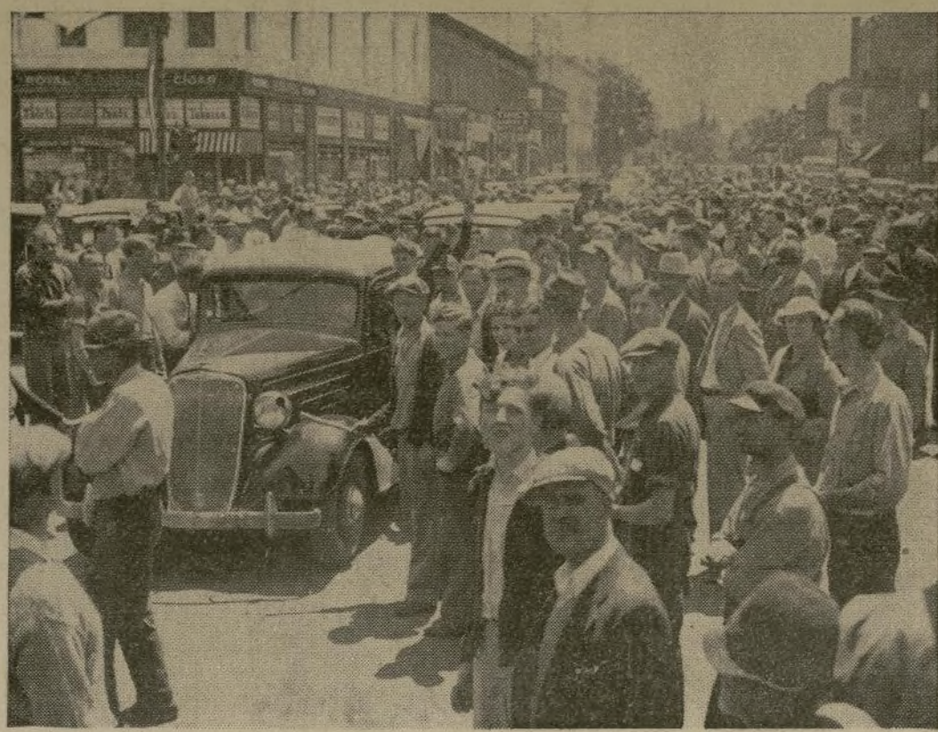
Escena en la calle que lleva al Capitolio del Estado, en Lansing, en la cual se ven algunos de los miembros de la Unión de Trabajadores de Automóviles de América, quienes hicieron que se cerraran todas las fábricas y tiendas en un "Día de fiesta obrera" declarado como protesta contra el arresto de ocho miembros de la Unión.