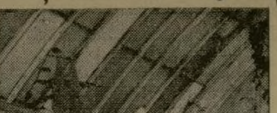
La "amorphepalus titanum," planta nativa de Sumatra, poco antes de abrirse para alcanzar una altura de 8 pies 5 pulgadas en el Jardín Botánico de Nueva York, en el Bronx. Solo cinco veces antes ha florecido esta flor fuera de las selvas de las Indias Orientales Holandesas.