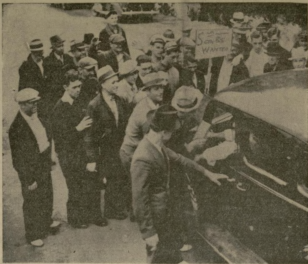
Los miembros de la línea de piquete preparándose a impedir que los empleados de la Newton Steel Company regresaran a sus trabajos, detienen un automóvil de estos trabajadores. Más tarde el alcalde de Monroe, D. A. Knages, organizó sus fuerzas y derrotó a los huelguistas en menos de 15 minutos. Más de 800 trabajadores regresaron a sus labores.