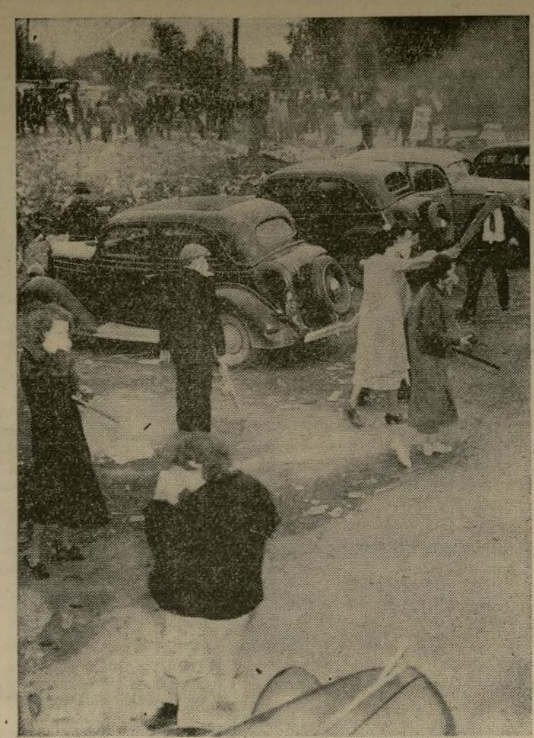
Mujeres simpatizadoras en la cocina de los huelguistas colocada en un camino que lleva a la fábrica de la Newton Steel Company, en Monroe, las cuales habían recogido una gran cantidad de piedras para el uso de los piquetes, sienten los efectos de los gases lacrimosos. Diez personas fueron llevadas al hospital después de una batalla con la policía.