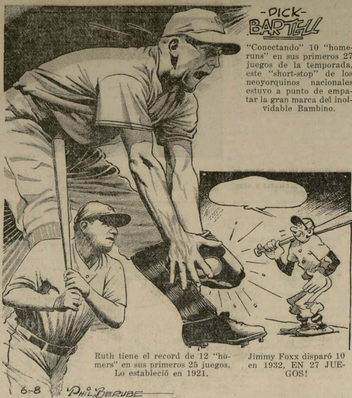
Ruth tiene el record de 12 "home-runs" en sus primeros 25 juegos. Lo estableció en 1921.