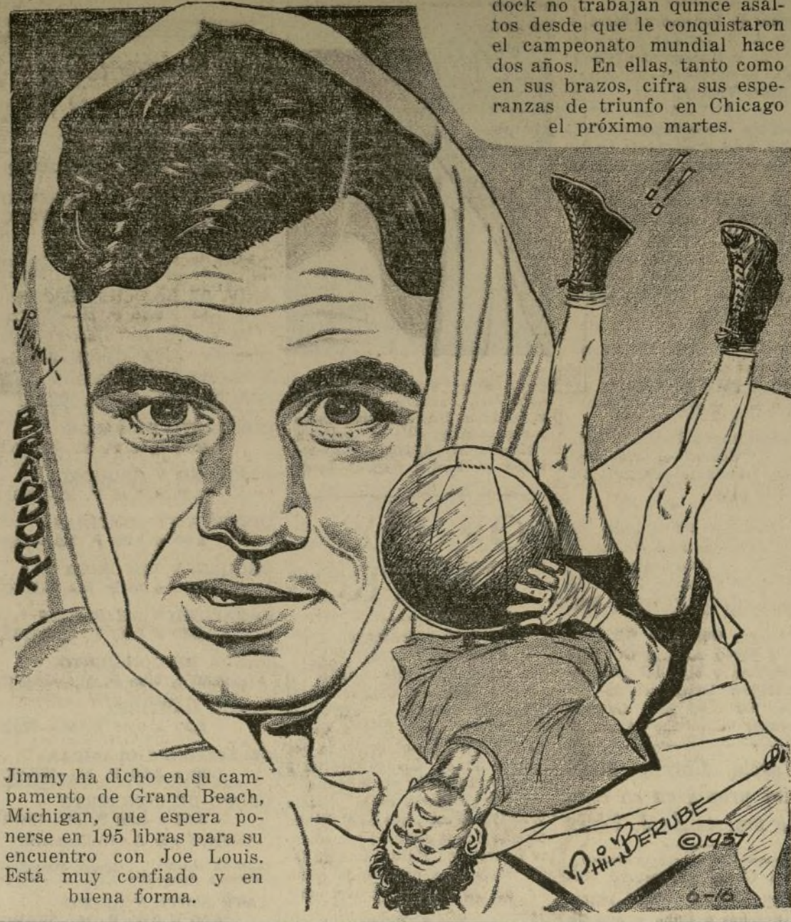
Jimmy ha dicho en su campamento de Grand Beach, Michigan, que espera ponerse en 195 libras para su encuentro con Joe Louis. Está muy confiado y en buena forma.