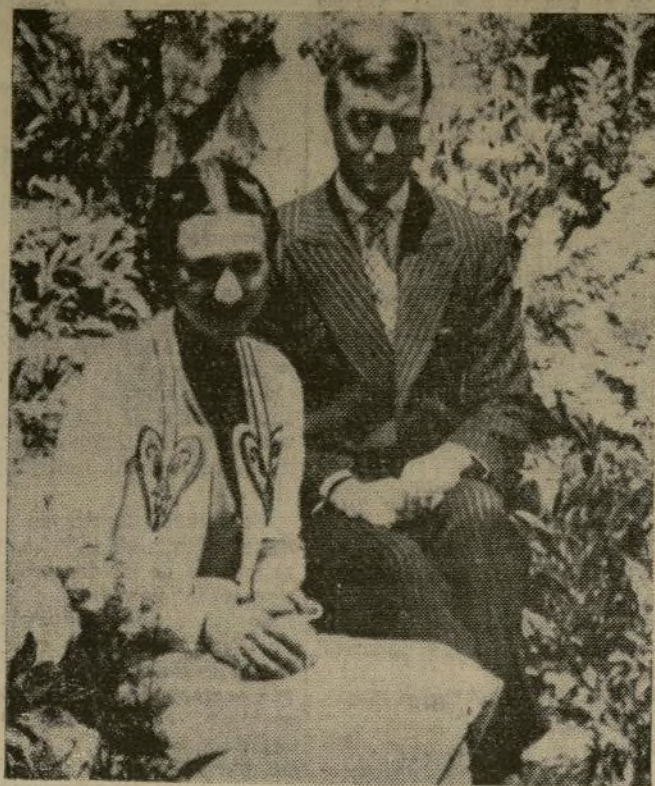
El duque y la duquesa de Windsor permiten que les tomen fotografías después de su llegada al "Castillo Encantado" de Wasserleoburg, cerca de Noetsch, en donde tienen el plan de permanecer por algunos meses.