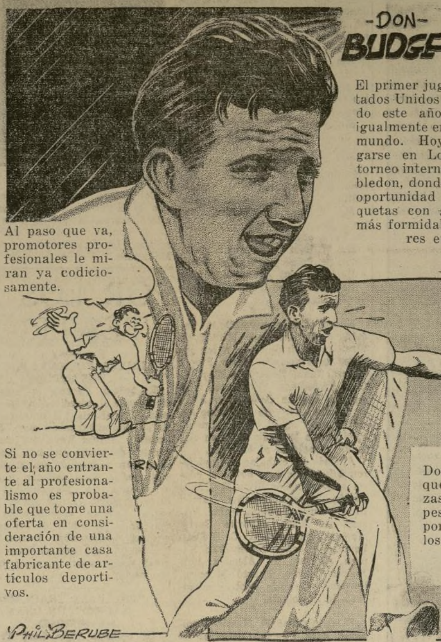
Si no se convierte el año entrante al profesionalismo es probable que tome una oferta en consideración de una importante casa fabricante de artículos deportivos.

El primer jugador de los Estados Unidos parece destinado este año a convertirse igualmente en el primero del mundo. Hoy empieza a jugarse en Londres el gran torneo internacional de Wimbledon, donde Budge tendrá oportunidad de cruzar raquetas con algunos de sus más formidables competidores europeos.