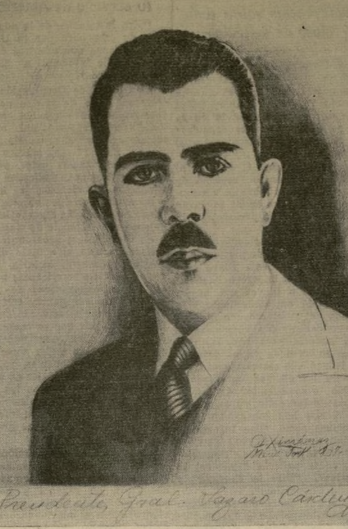
GENERAL LAZARO CARDENAS