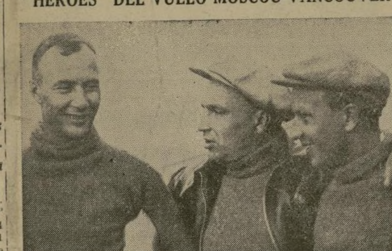
Navegador Alexander Beliakov, piloto Valeri Chkalov y piloto Georgi Gaidukov (izquierda a derecha), pilotos que realizaron el primer vuelo sin escala entre Rusia y los Estados Unidos por la ruta del Polo Norte.