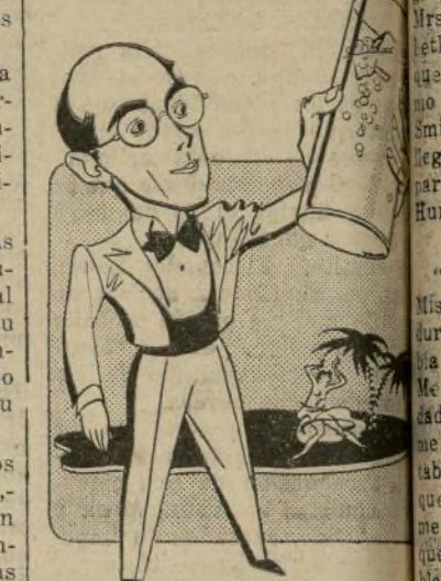
LOS NORTEAMERICANOS me han tratado muy bien

Los unionistas, agregaban, están empleados en doce establecimientos industriales, entre los cuales se incluye, empresas siderúrgicas, telefónicas, eléctricas y trabajos de la W.P.A. Entre tanto, en otra maniobra en la controversia de tantos as-