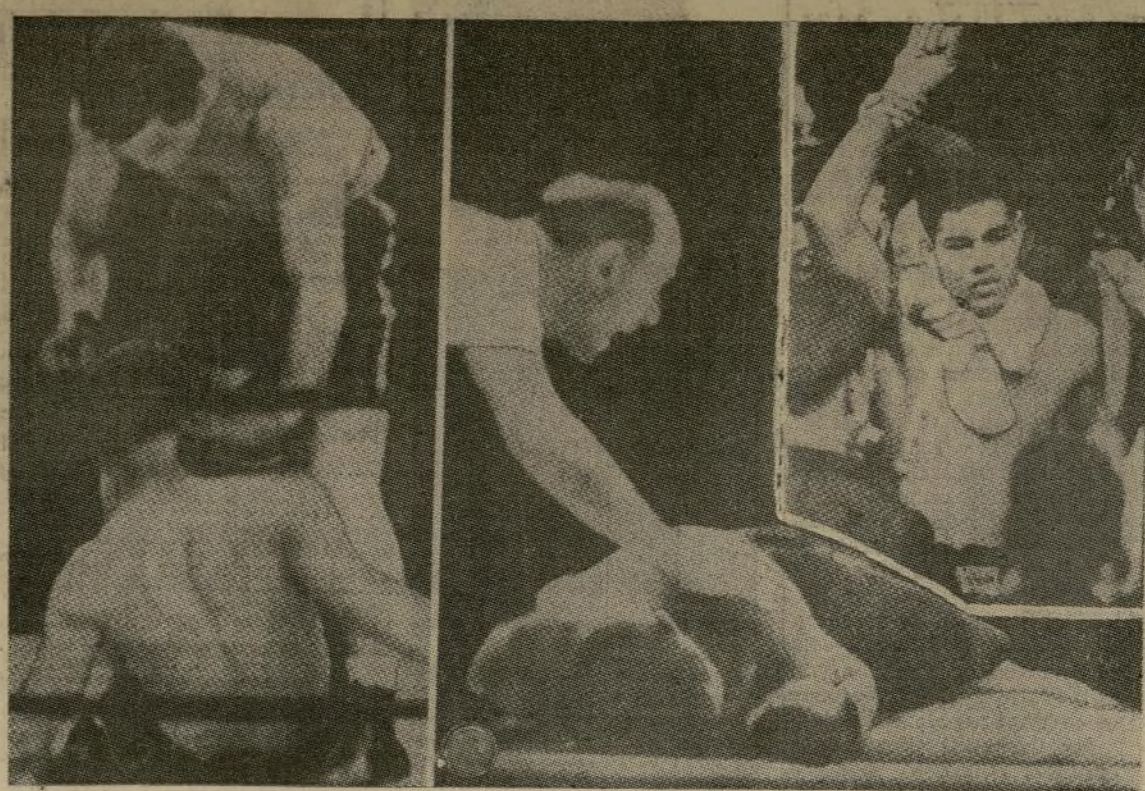
Interesantes aspectos de la batalla de Chicago en la que conquistó el campeonato mundial de boxeo Joe Louis.