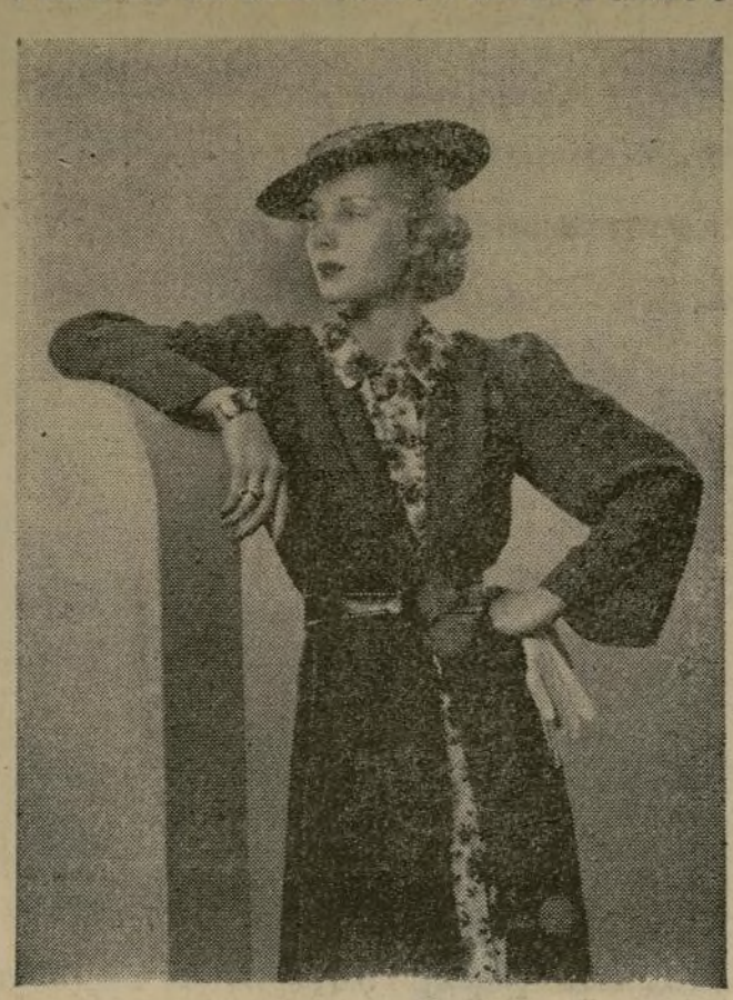
El chaquetón, de crespón esmeralda, se usa sobre un traje floreado. Los botones sobre el vestido son en forma de moscón. El sombrero marino de paja y el cinturón de piel hacen juego con el chaquetón.