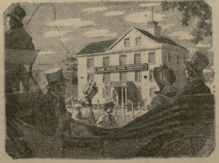
El Primer Banco de Ahorros de New York (como se veía en 1819)

El City Hotel, el primer hotel del cual se vanagloria nuestra ciudad, estaba localizado en Broadway, arriba de la Iglesia Trinity. Construido en 1806, en el sitio de la histórica y antigua residencia Delancey, era pues natural que este famoso hotel albergase al grupo de ciudadanos interesados en el bienestar público, los que se reunieron en el otoño de 1816 para organizar el primer banco de ahorros de New York, The Bank for Savings.