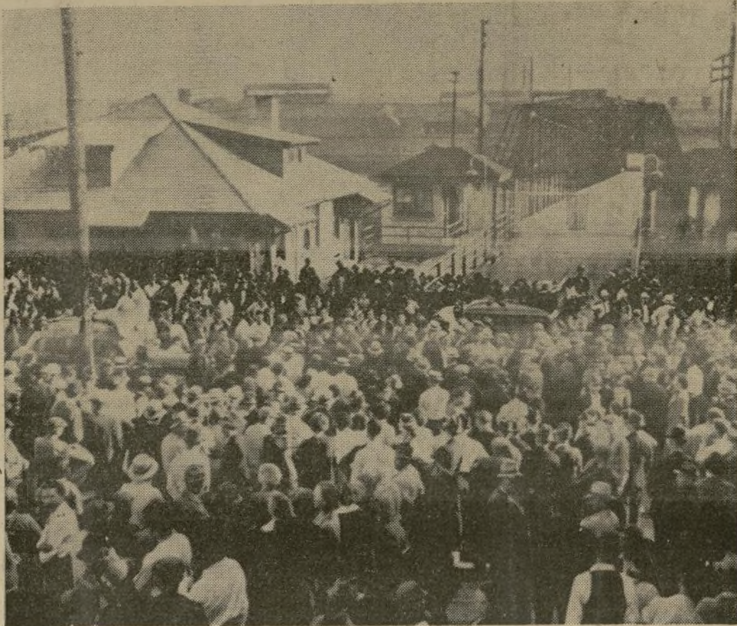
Líneas de "piquetes" frente a los talleres de la "Youngstown Sheet & Tube Co." en el Estado de Ohio el día antes de que llegaran los soldados de la Guardia Nacional a hacerse cargo de la situación y a obligar a las compañías a no abrir sus puertas hasta que se den por terminadas las negociaciones entre patronos y representantes de los obreros en huelga.