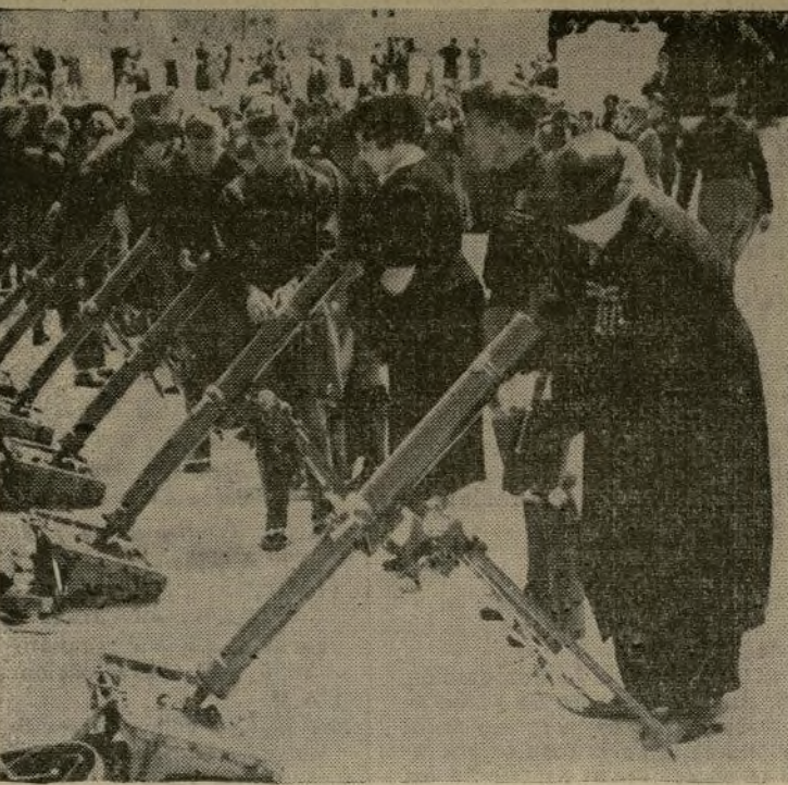
Enlutadas mujeres, cuyos esposos fueron muertos durante la conquista de Etiopía, adornando armas en una demostración de unidades de artillería en una plaza de Roma durante una revista por el primer ministro Mussolini, oficiales del ejército y funcionarios del gobierno.