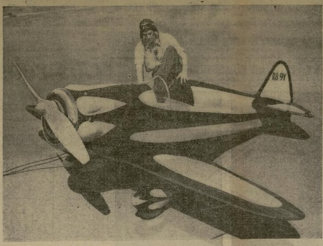
Tony Levier, de San Diego, Calif., piloto y constructor, trepándose a la cañilla de su "pulga voladora" que él entrará en las carreras aéreas nacionales de Cleveland. La avioneta de 404 libras de peso, con envergadura de 14 pies y motor de 90 caballos, tiene una velocidad máxima de 225 m.p.h., y una autonomía de 525 millas.