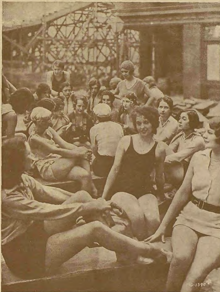
Las bailarinas de Sammy Lee, durante el ensayo de una nueva producción de la M. G. M., dirigida por Charles Riesner

Porque, aparte hipocresías del oficio, cualquier mortal no tendría inconveniente en bailar el tiempo que fuese necesario con cualquiera de estas bailarinas de Sammy Lee, que descansan, al parecer tan tranquilas, después de su cotidiana sesión.