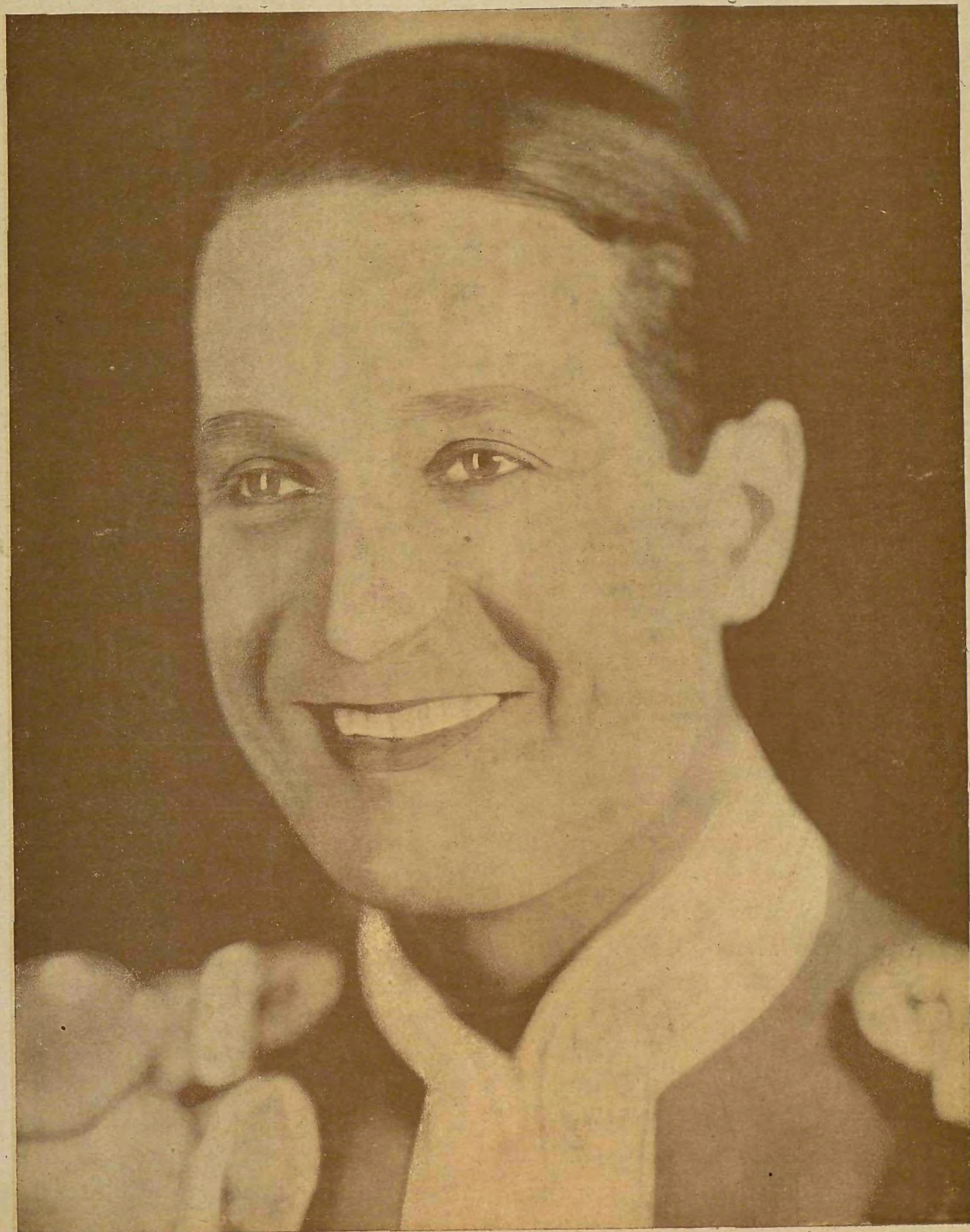
Mauricio Chevalier, el famoso artista de la Paramount, intérprete de la nueva película «El desfile del amor»