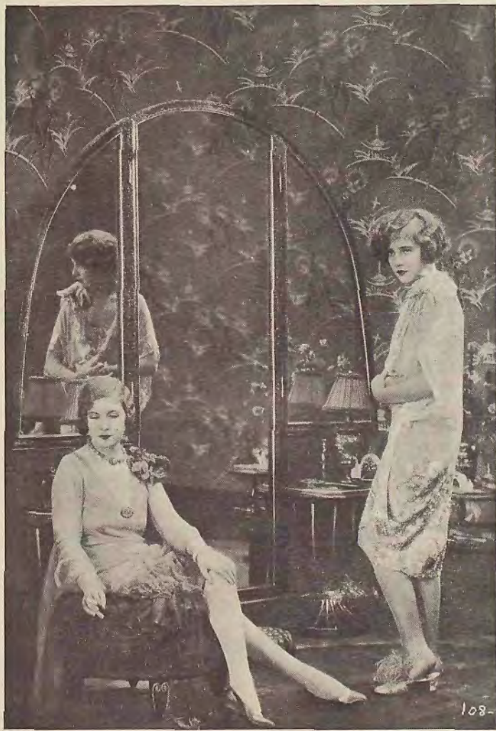
Lillyan Tashmann y Louise Wilson en la casa que ésta última posee en Hollywood.

Louise ha suspendido su toilette para pensar, mientras Lillyan, negligentemente, se sienta sobre un taburete bajito, sin preocuparse de que deja al descubierto algo que el fotógrafo se apresurará a recoger en su cámara oscura... y en su memoria, porque vale la pena. Las pantorrillas de Lillyan Tash-