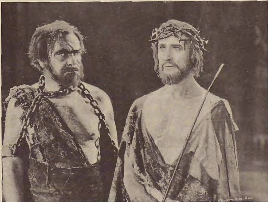
Rodolfo Schickel y H. B. Warner en una escena de la película religiosa «El Rey de Reyes»

sus actores la indumentaria de los siglos pasados.