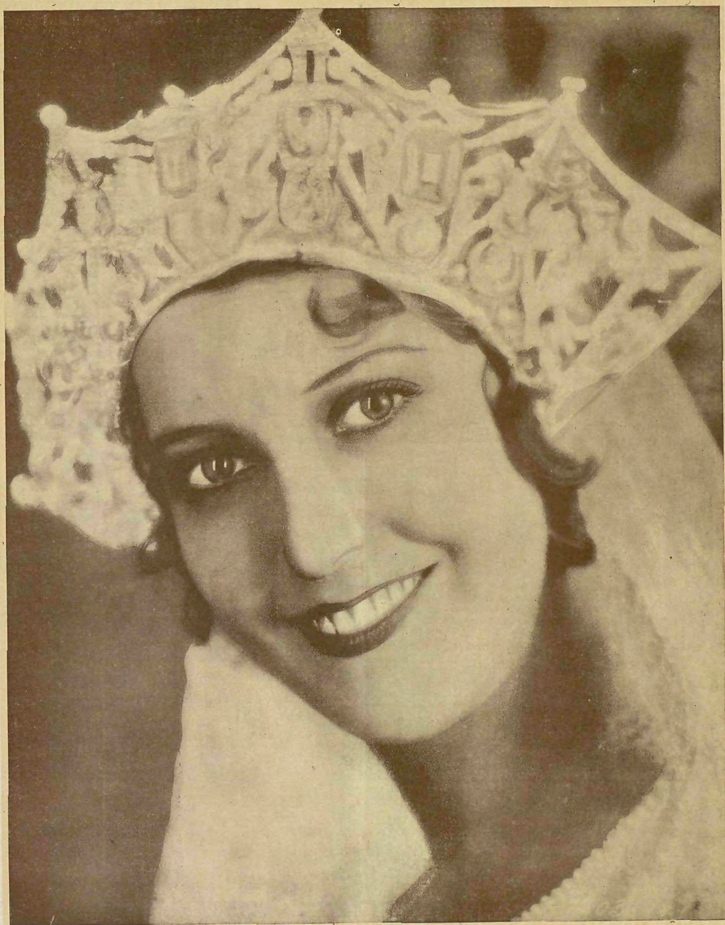
Jeanette Mac Donald, la bellissima artista de la Paramount, intérprete con Chevallier, de la película «El desfile del amor»