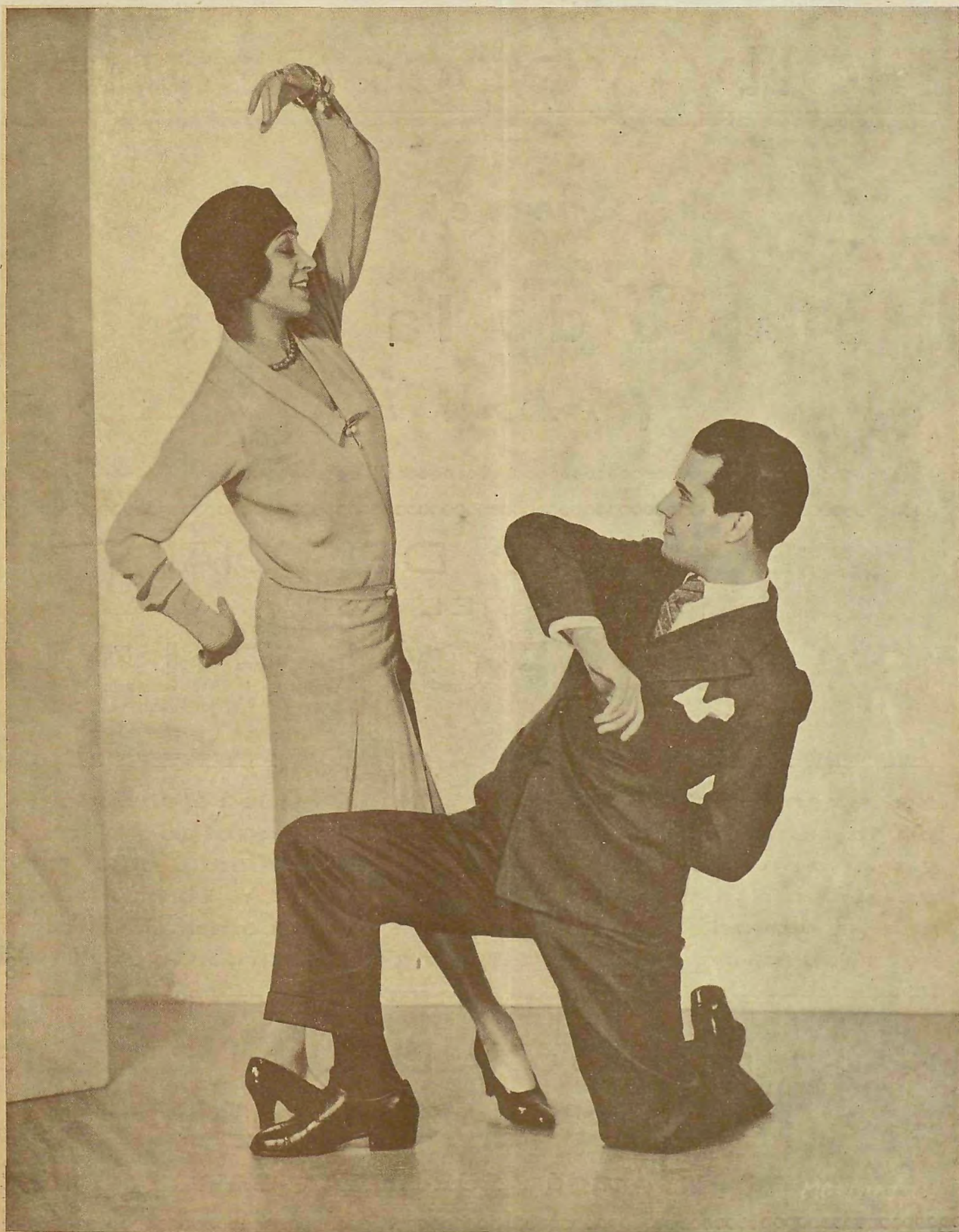
Ramón Novarro y La Argentina, ensayando unos bailes de la nueva película «La canción de Sevilla» Ayuntamiento de Madrid

La tarjeta postal que se regala en este número corresponde a Norma Talmadge