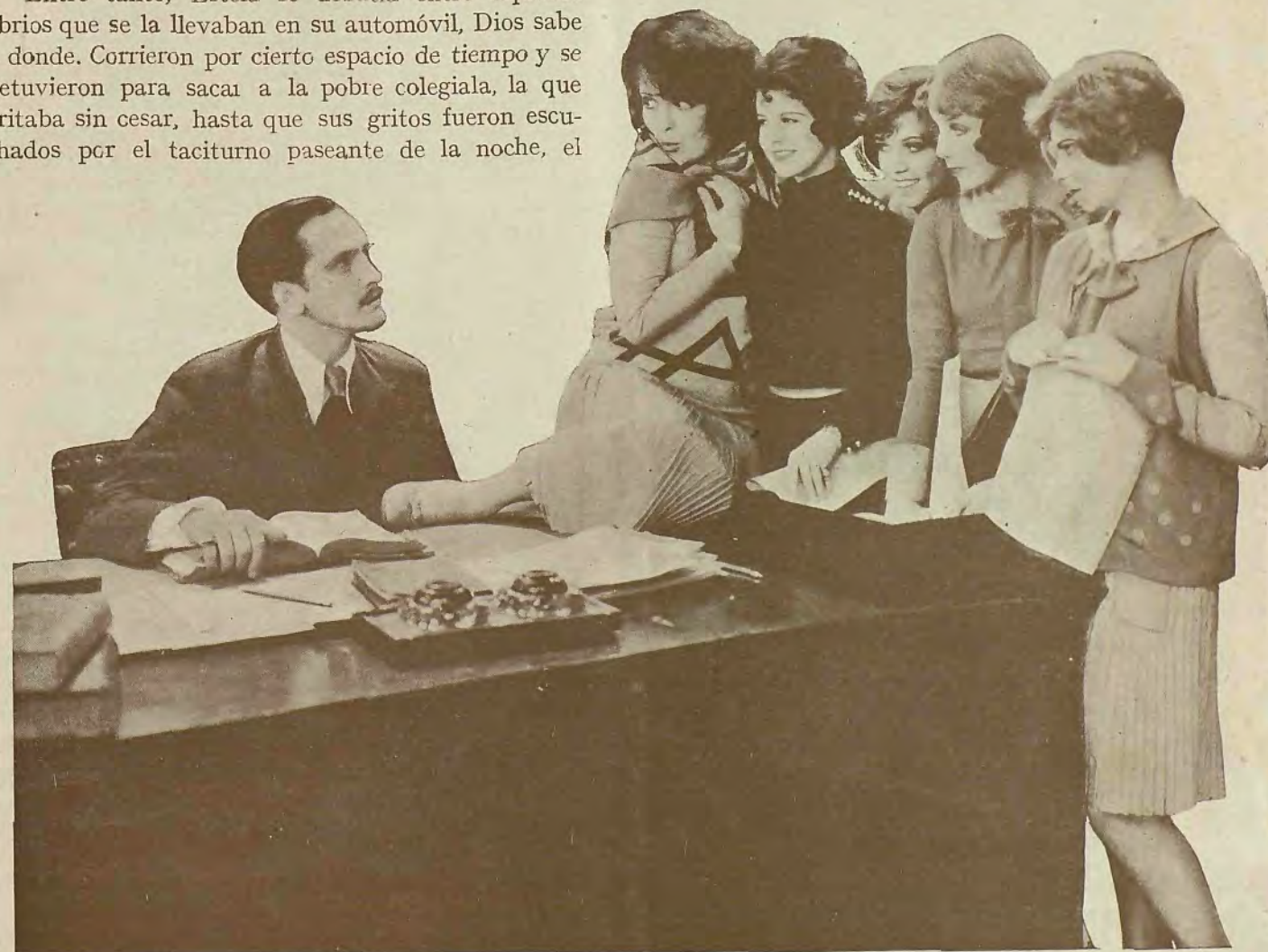
Otra escena de «La loca orgía» con todos sus intérpretes