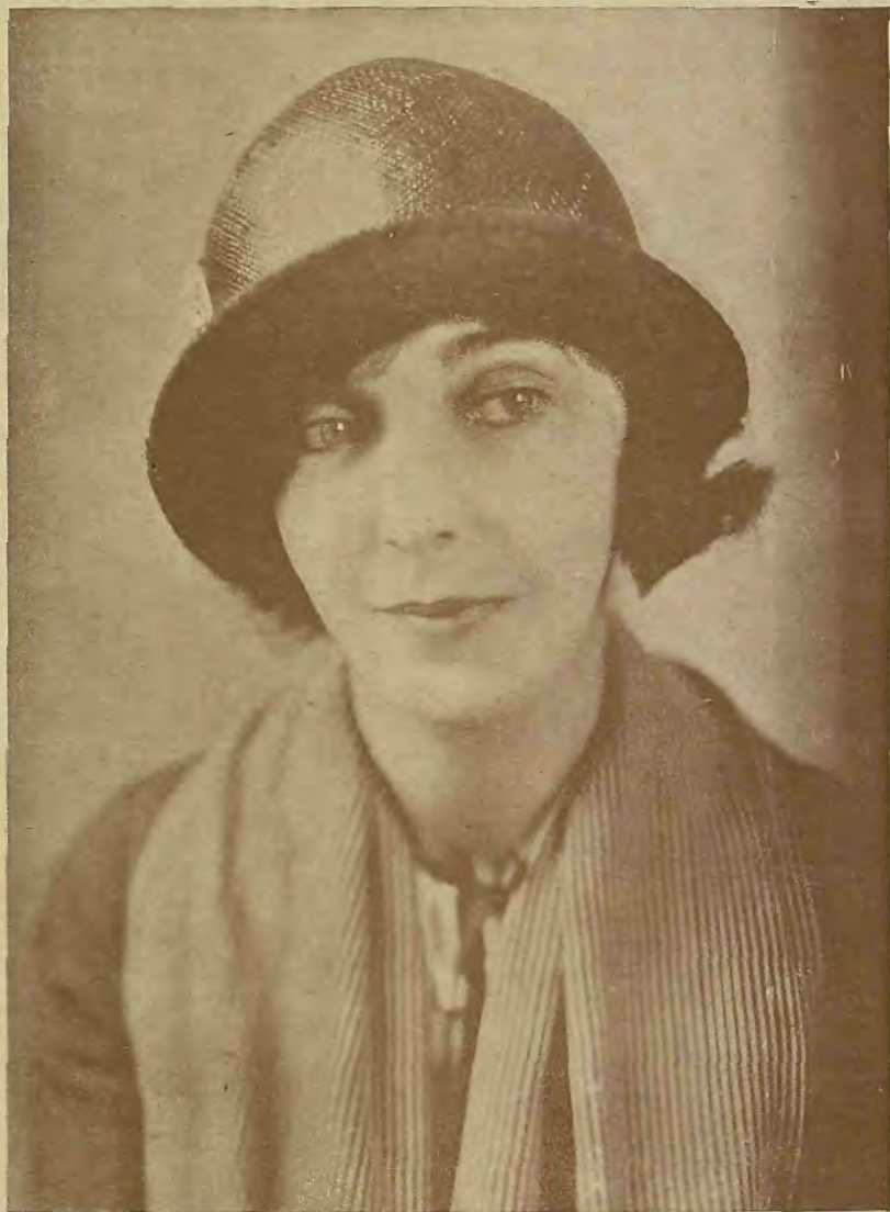
Zasu Pitts, en Avaricia , film de von Stroheim, inédito en España, y llevado por nuestro colaborador Juan Piqueras al Cineclub, en donde obtuvo un éxito

tivos. A las del otro grupo rara vez se les concede una importancia espectacular; siempre "hacen" segundos o terceros papeles: o mujeres perversas o esposas engañadas. Nunca el tipo cinematográfico que harían sin esforzarse, que llevan dentro.