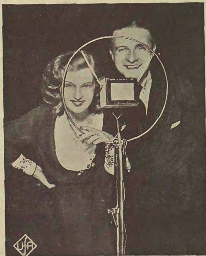
Lillian Harvey y Willy Fritsch hablando al público de Ulená desde el micrófono de la radio

Nos dirigimos a casa de Lillian Harvey y escogemos para nuestra visita una hora en que es natural que los esposos—incluso los esposos secretos—se encuentren juntos: por la mañana temprano. Encontramos a Lillian Harvey ya levan-