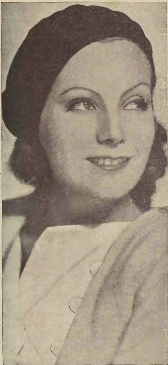
Ultimo retrato de la célebre artista sueca Greta Garbo

Viendo lo imposible que era hablar con ella, me siento en la escalera del hotel en que se hospeda para ver si se le pasaba el mal humor y la daba compasión de mí. Pero pasaron tres horas, y, cuando ya me iba a quedar dormido, noto un ligero golpe en el hombro izquierdo, vuelvo la cabeza (cosa natural, ya que el golpe fué dado por la espalda) y me encuentro ante mí al gran Valentín Parera.