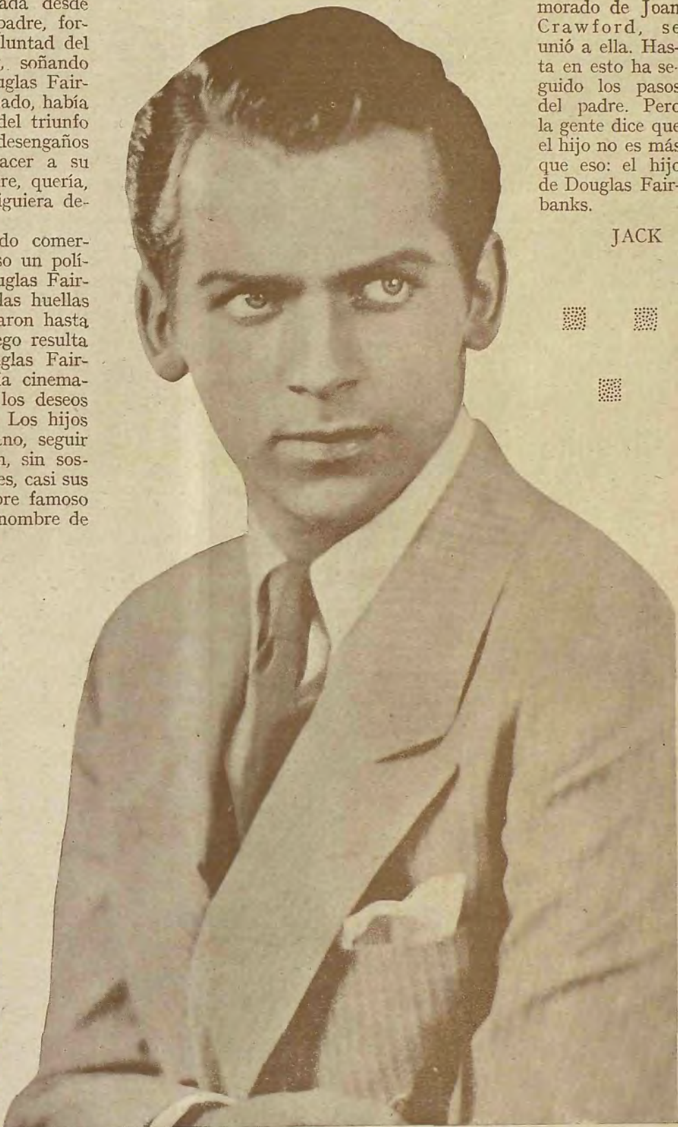
Douglas Fairbanks, hijo

SINCRONISMO PERFECTO SONORIDAD INMEJORABLE