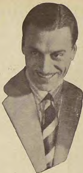
Ultimo retrato del céle- bre artista español Va- lentín Parera