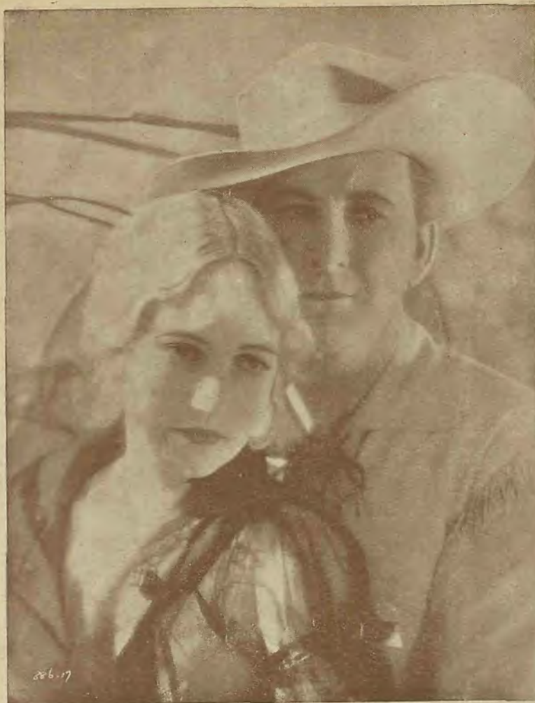
Marion Douglas y Tim Mac Coy, protagonistas de esta interesante película