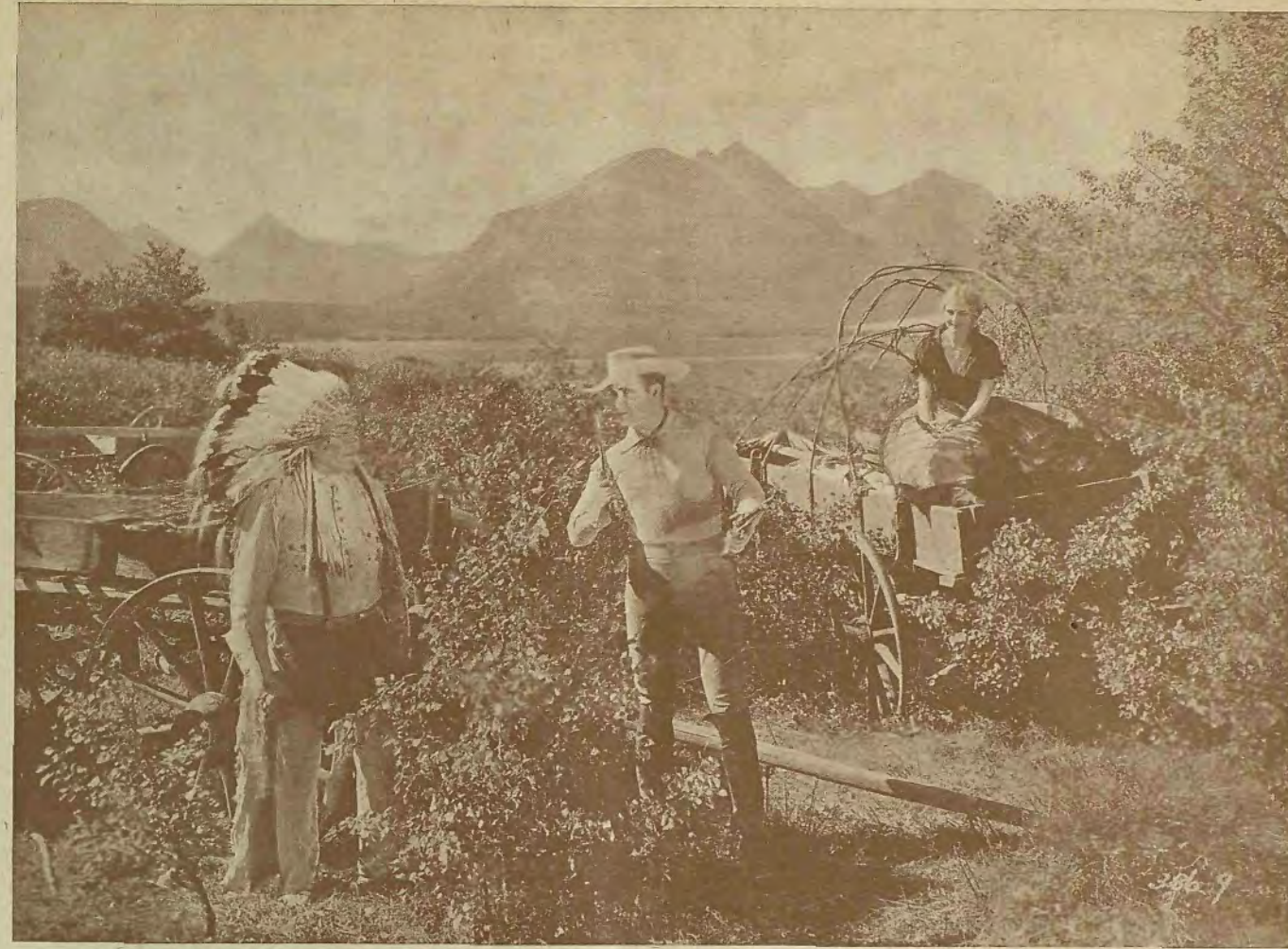
Una bonita escena de «Sangre india», de la Metro

Aguila Solitaria , habiéndose percatado de que el que se interponía en sus fechorías era Jim Boom, decidió recurrir a un último y cobarde medio para deshacerse de su enemigo, y una noche, al frente de los guerreros de su tribu, asaltó la factoría del padre de Bárbara, la que al ruido de las detonaciones se