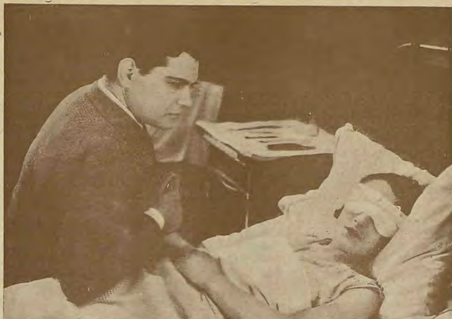
Una escena de la película española «La canción del día», estrenada en el Real Cinema

Aun exponiéndome a ser tachado de exigente, no he de privarme de manifestar que, aparte la curiosidad que despierta una película hablada, La canción del día no me interesa; esto no significa, en modo alguno, que no esté bien realizada, sino simplemente que en ella no encuentro novedad digna de atención. Es una especie de sainete-revista, con sus toquecitos sentimentales y sus chistes correspondientes. El asunto, en que, por cierto, hay un inglés que no ha aprendido a pedir café y no obstante se hace comprender de todo el mundo (!), es ni más ni menos que otros que hemos visto pasar. En la parte lírica, el inspirado autor del schotisch de la garcon, con, con , nos ha servido unos números que, si dentro de poco no son popularizados por las domésticas, se deberá, exclusivamente, a que muchas de ellas no puedan abonar cuatro pesetas por oírlos, o a que, obedeciendo a su sentido práctico, prefieran gastar menos y oír cantar de verdad. La acción, aunque un poco lenta, está bien llevada