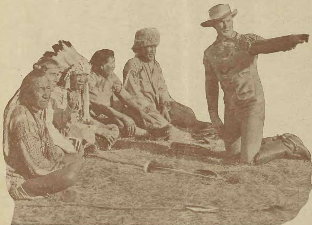
Una escena de Mac Coy y los indios en el film «Sangre india»