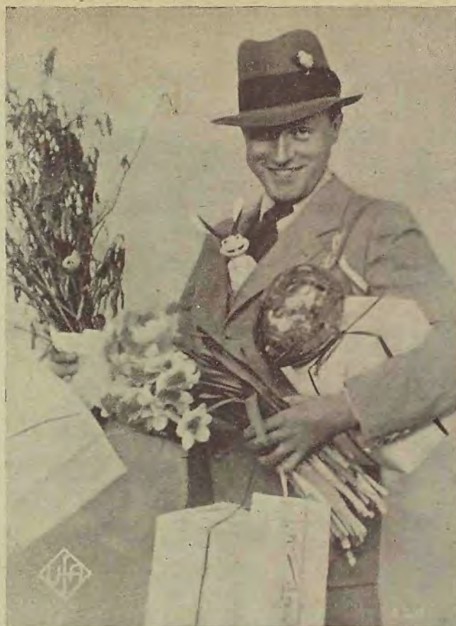
Los regalos con que Willy Fritsch obsequia a su prometida Lillian Harvey

tada y de un humor excelente que por sí solo nos hace ya dudar de la "verdad". Es imposible que la esposa legítima de un hombre tan sometido a la "competencia" como Willy Fritsch, pueda estar de tan buen humor a primeras horas de la mañana, tanto más cuanto que en la casa no nos fué posible descubrir ni un solo sombrero que delatara en ella la presencia de un sér del sexo opuesto. Para entrar en materia felicitamos a la encantadora artista por su boda secreta.