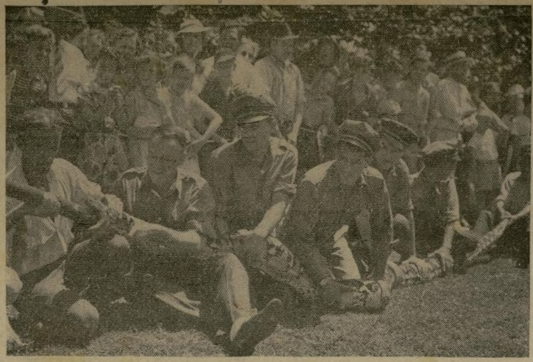
"Blondie," serpiente boa de 19 pies, del Zoológico de St. Louis, recibe 14 libras de alimento molido con la ayuda de un tubo de metal y una baqueta mientras siete guardias la sujetan durante un proceso de alimentación forzosa que fue presenciado por centenares de espectadores de vista en el Zoológico.