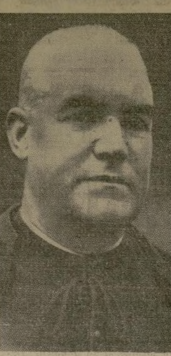
El arzobispo de Toledo, Isidoro Goma, primado de la Iglesia de España, desde el establecimiento de la República, se dice, ha sido designado representante del Vaticano ante los Rebeldes españoles.