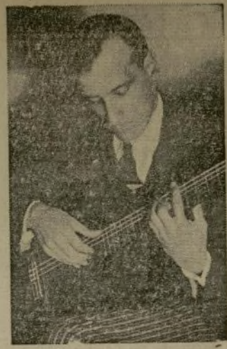
J. MARTINEZ OYANGUREN

Excelente guitarrista uruguayo que dará un recital digno de ser oído el sábado próximo a las 8:30 de la noche, en Town Hall, formado por composiciones clásicas y modernas de conocidos autores.