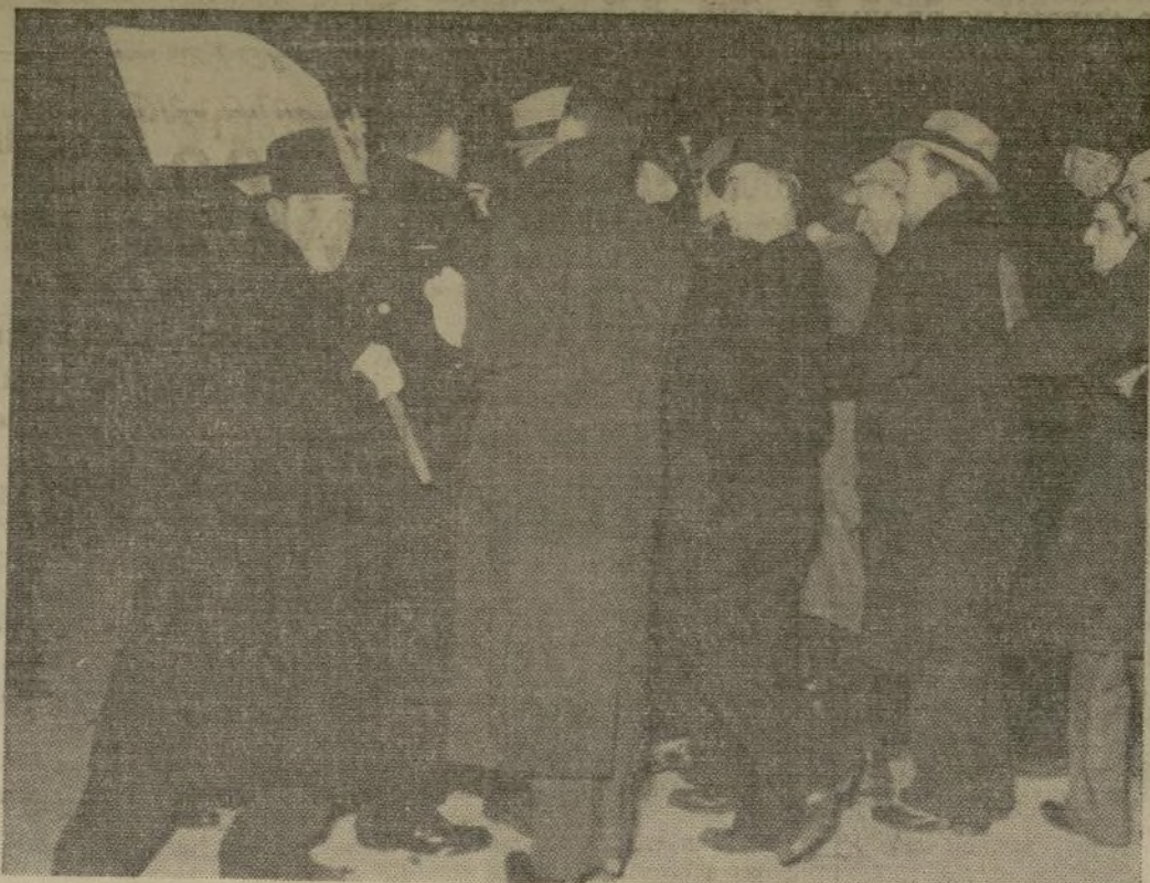
Un solo policía de Detroit tratando de dispersar a los hombres que hacían servicio de "picket" a la entrada de la fábrica Briggs Body, evitando la entrada de los trabajadores tratando en orden alrededor de la fábrica. La policía usó más tarde bombas de gases lacrimosos.