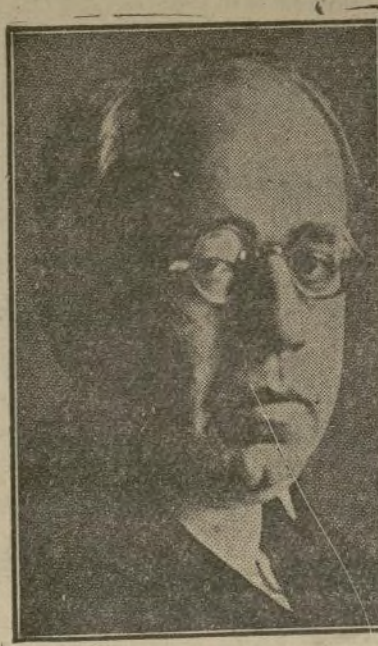
Don Manuel Azaña

MÁLAGA, España, enero 21. (AP).—Los aviones insurgentes (Sigue en la sexta página)