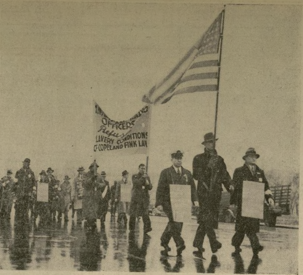
Algunos de los 1,200 marineros en huelga de Baltimore, Norfolk, Filadelfia, Nueva York y Boston dirigiéndose en manifestación hasta el Edificio del Comercio en Washington para protestar contra la ley Copeland. Los secretarios Roger y Perkins, después de darle café y emparedados prometieron ayudarlos. Los marineros salieron ya de regreso a sus hogares de la capital nacional.