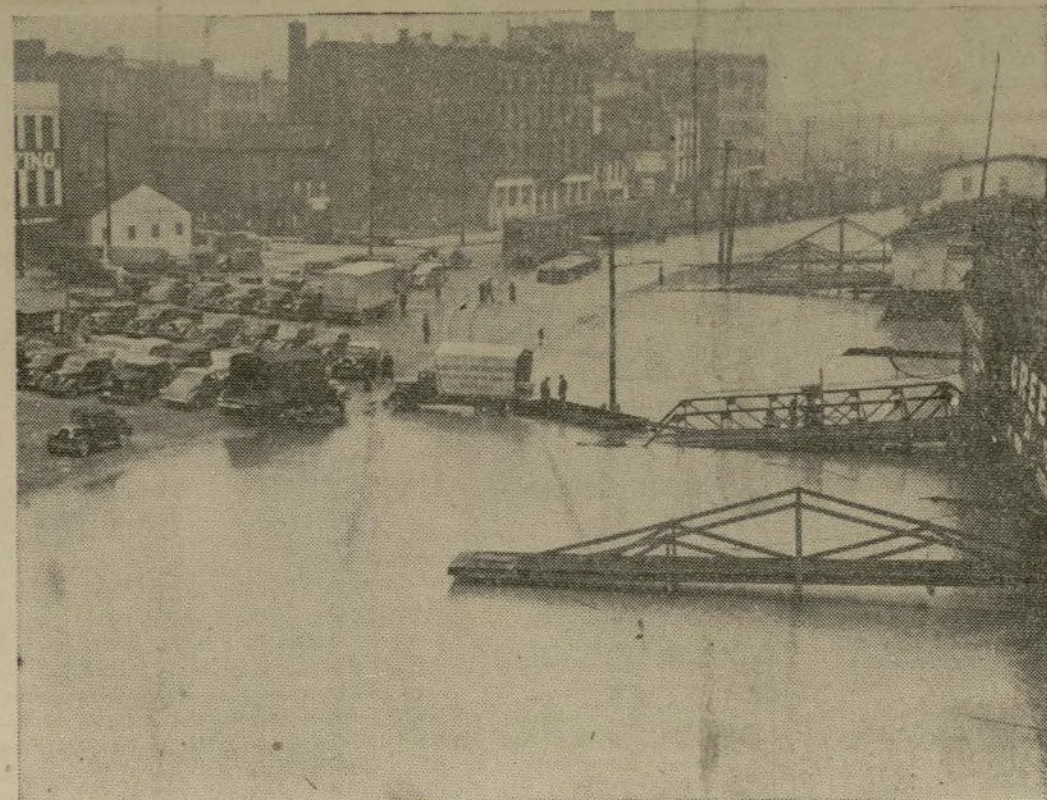
Una escena en la ciudad de Cincinnati la cual se encuentra en la ribera del Río Ohio, cuyas aguas se han desbordado últimamente ocasionando grandes pérdidas. Las agencias de ayuda se preparan para dar albergue y alimentos a diez mil personas que viven en las regiones afectadas por la gran crecida.