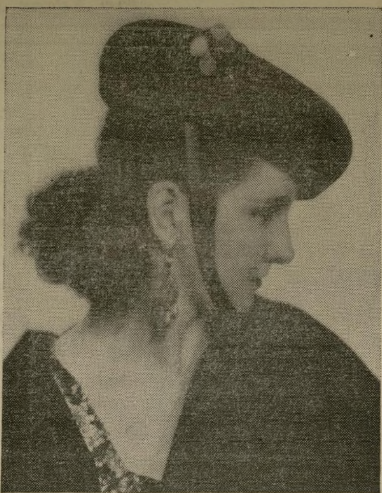
Carola Goya, conocida intérprete de bailes, españoles que dará su único recital en esta ciudad en el Guild Theatre el domingo de la entrante semana. En este recital Miss Goya presentará nuevas creaciones, suyas.