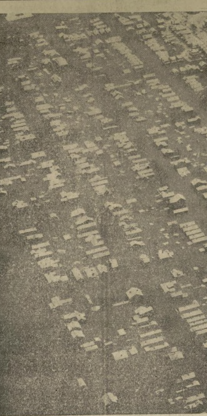
Fotografía tomada desde un aeroplano de la ciudad de Covington, la cual se encuentra frente a Cincinnati, al otro lado del río Ohio, donde ha ocurrido una de las más grandes inundaciones de la historia. Covington está casi toda inundada y los negocios han quedado totalmente paralizados.