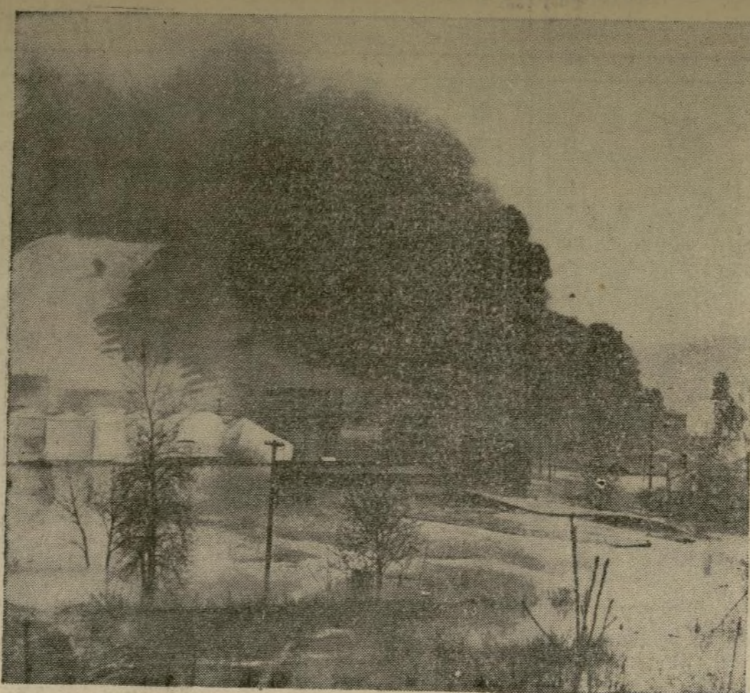
Humareda que salía de un almacén de la Balmore & Ohio en la ciudad de Cincinnati. El incendio destruyó totalmente el mencionado almacén. El fuego empezó con la explosión de un tanque de petróleo. A la izquierda pueden verse tanques de material inflamable de la Standard Oil Co.