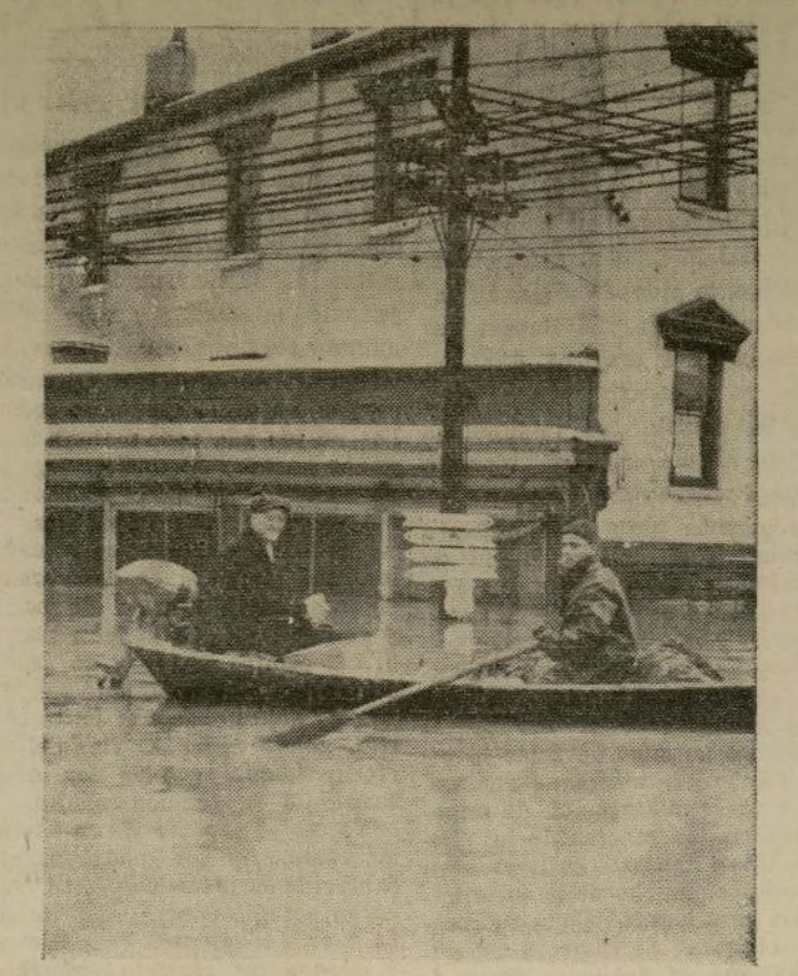
Dos personas en un bote navegando por las calles de Cincinnati, una de las ciudades más afectadas por la creciente del río Ohio. Puede notarse que el nivel del agua casi llega a la ventana del segundo piso del edificio que aparece en el fondo del grabado.