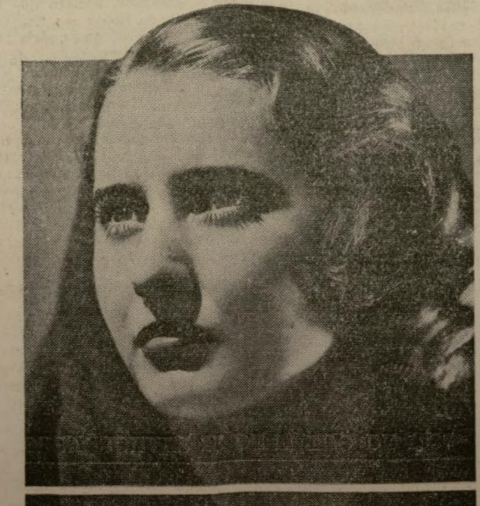
Barbara Stanwyck, protagonista de la película "The Plough and the Stars" que empieza a presentarse desde mañana jueves el Radio Music Hall. Esta es la última película de la célebre actriz del cine parlante.