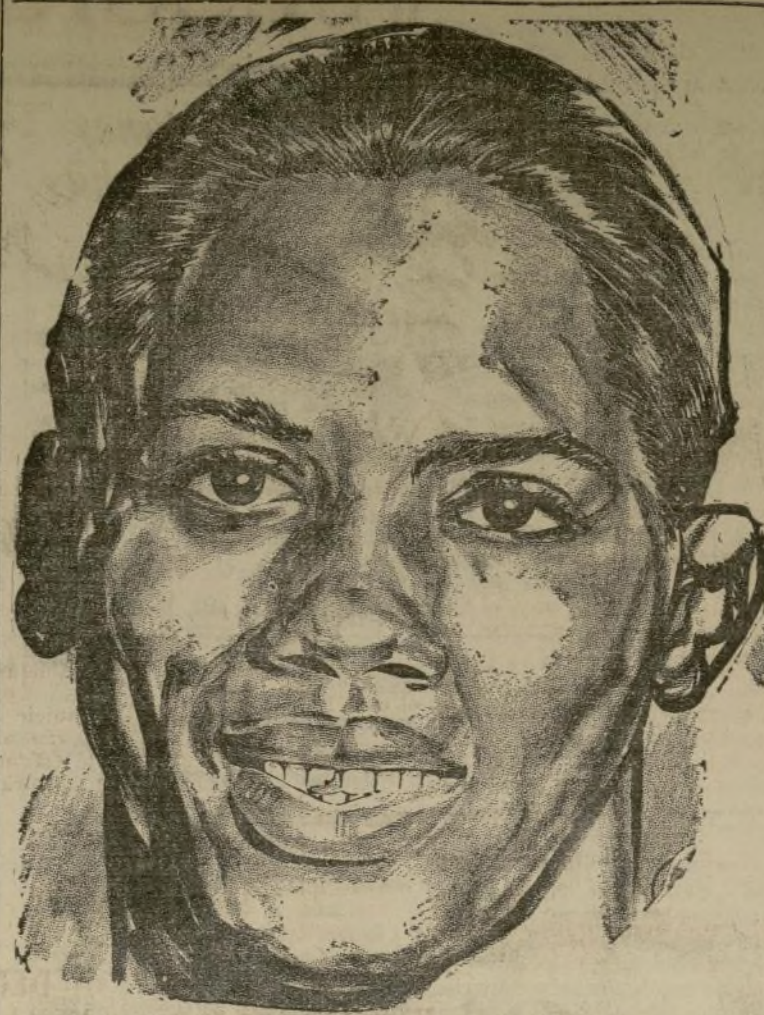
Kid Chocolate, ex-campeón mundial del peso puma.