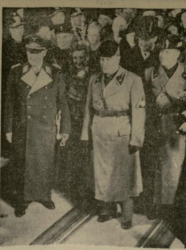
El coronel general Herman Goering (izquierda), ministro de Aviación del Reich, en sus conferencias con Mussolini acerca de la crisis española, las cuales fueron causa de grandes comentarios en la prensa del mundo entero.