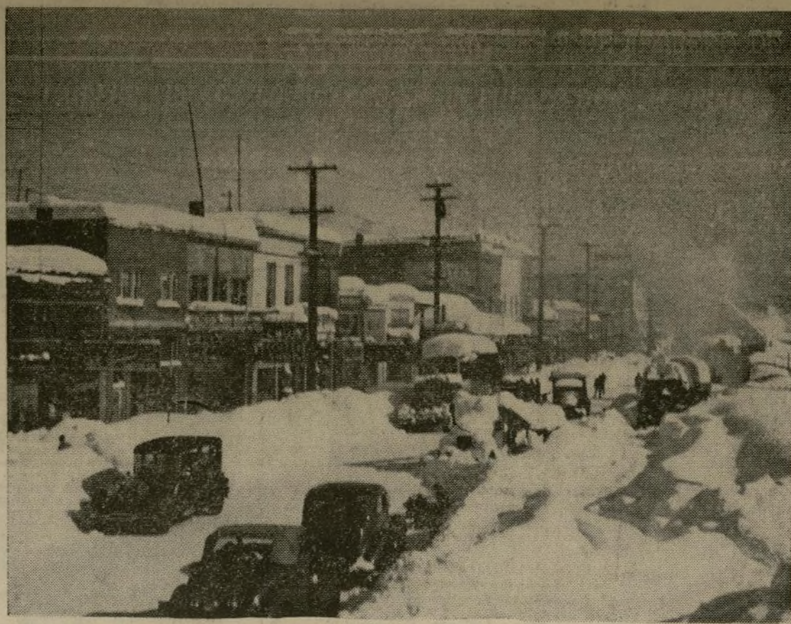
La calle principal de Truckee, centro deportivo de las Sierras, después de una nevada de cuatro días, en la cual se reunió mayor cantidad de nieve de la que la población había visto en tres décadas. Un frío intenso se registró en una gran parte del Estado y varias ciudades situadas más hacia el Norte a lo largo de la costa registraron temperaturas bajo cero.