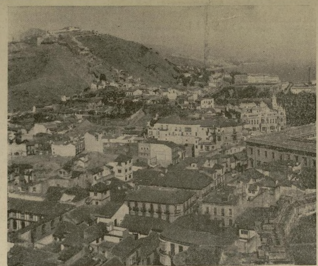
Ocupado por los insurgentes en acción combinada de mar, tierra y aire, el importante y heroico puerto español de Málaga, en el Mediterráneo, está siendo transformado por las tropas del general Quiroga en una base naval fascista.