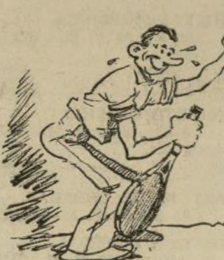
PHIL BERUBE ©1937

"Y Albión quiere ver a Fred frente a Vines."