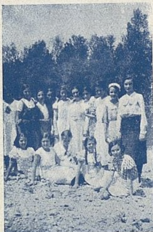
Parroquia de San Antonio de la Florida.—Madrid Aspirantes de excursión