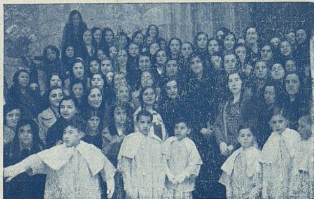
Algunas aspirantes de Burgos con sus delegadas

Aquí me tenéis con medias, y muy contenta por haber sacrificado esa vergonzosa moda en aras de disipar el enojo de nuestra Purísima Madre.