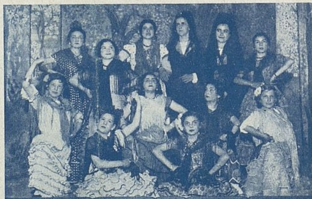
Las aspirantes de Sevilla festejan a la Presidenta nacional