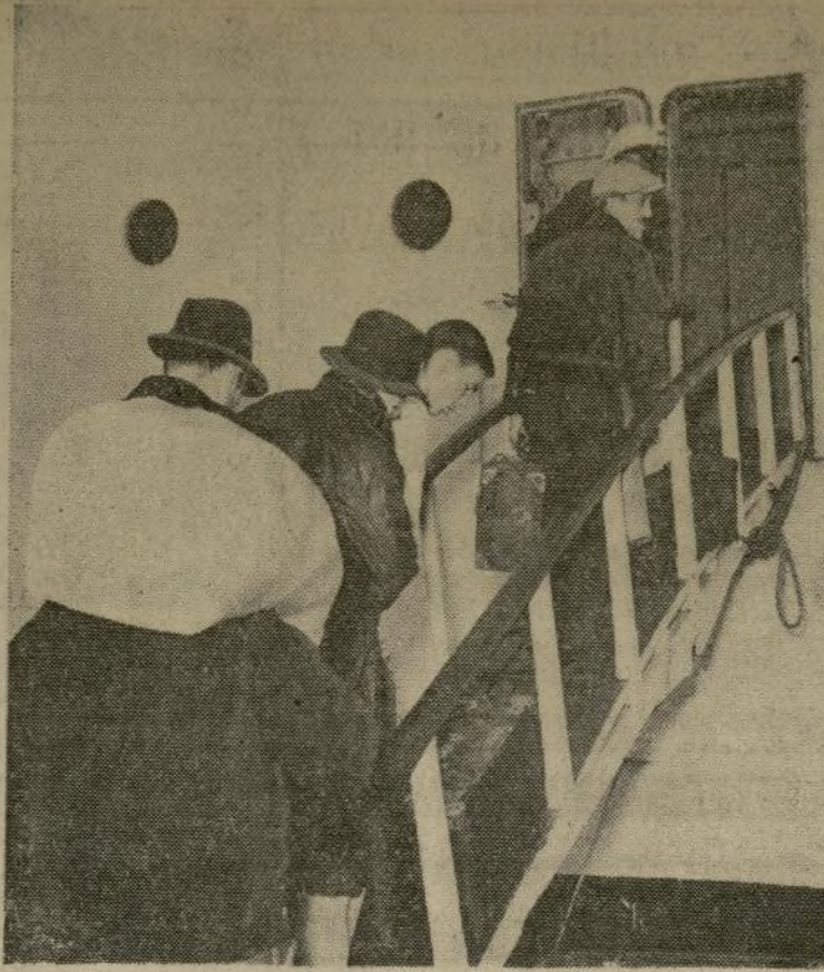
Obreros marítimos, de los que se unieron al paro declarado en la costa del Pacífico, regresando a sus labores para reanudar el interrumpido funcionamiento de los buques que quedaron paralizados por el paro. He aquí un grupo que entra al vapor "Maharaja", uno de los 82 buques que quedaron inactivos en la Bahía de Los Angeles, California.