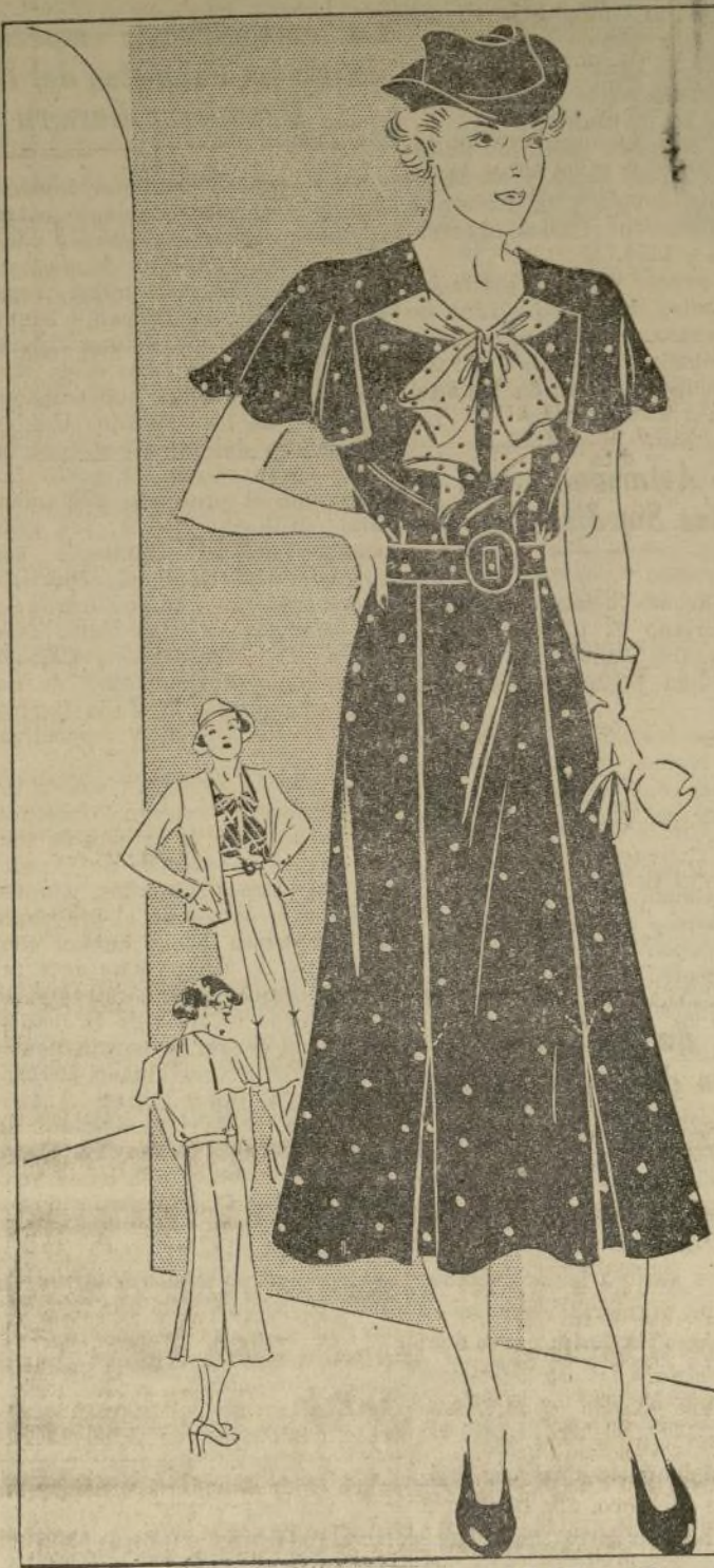
VESTIDO DE CHAQUETA MUY CORRIENTE PARA PRIMAVERA