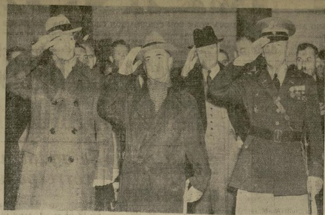
El presidente Manuel Quezón (centro), acompañado del general Douglas MacArthur, ex-jefe del Estado Mayor del Ejército de los Estados Unidos y hoy director del programa de defensa de las Filipinas, corresponde al saludo de 19 cañonazos disparado en el Fuerte MacArthur a su llegada a Los Angeles. A su derecha está el teniente coronel C. M. Thiele, comandante del fuerte.