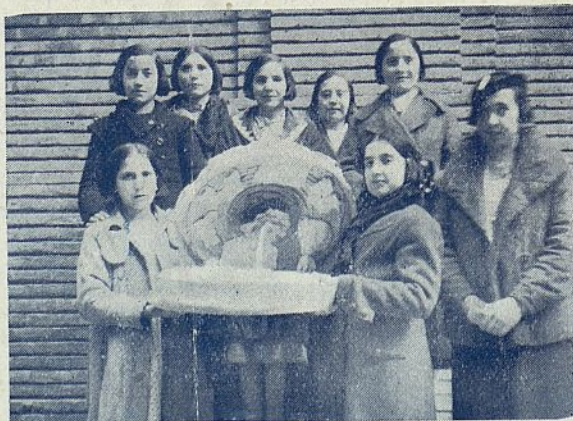
Grupo de Aspirantes que confeccionaron la canastilla y su Delegada.

También necesitamos los nombres de las correspondientes.