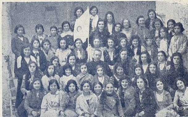
Grupo de Aspirantes con el Consiliario y sus Directivas.