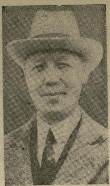
Doctor Enrique Olaya Herrera