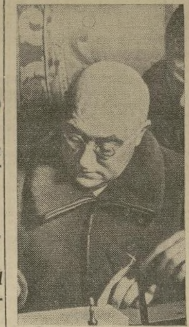
General José Miaja

Estos son, dice él, parte cósmicos y parte terrestres. Todos los rayos que se originan